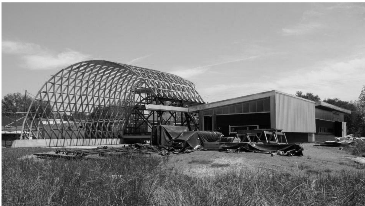
Klubház, Akron, USA. Építészet: The Rural Studio

A lényeg az építészetben nem transzcendentális idea, hanem kézzelfogható szükség, szándék és építőkedv. A mesterség, amely kiműveli a művelőjét. Nem hatástalan értekezés az építészeztől, hanem az eredendő gyakorlati képesség, amelynek segítségével az ember ösidők óta gondolkozva konstruál. Amíg az építés mögött nincsen a helyben fellelhető erőforrások és szaktudás alkalmazását kedvezményező politikai szándék, és a bürokrácia kedvét szegi a vidéki és városi közösségek építészandékának, addig a technológia uniformisával és az építészkutatás akadémiusságával szemben nem lehet alternatívát felmutatni. Erre világított rá Samuel Mockbee tevékenységével már 1998-ban és Steven A. Moore 2005-ben, a „regeneratív építészeztől” szóló nagyhatású esszéjében (ld. a szerző tanulmányát az Utóiratban ). Olyan kiutat kerestek, amely egyszerre nemzeti és nemzetközi, utánozhatatlanul helyi és módszerét tekintve széles körben alkalmazható. Az építészet ideológiamentes, saját hangjának kérdése azóta több helyen a szakmai érdeklődés középpontjába került, melynek megválaszolása számunkra is időszzerű kihívás.