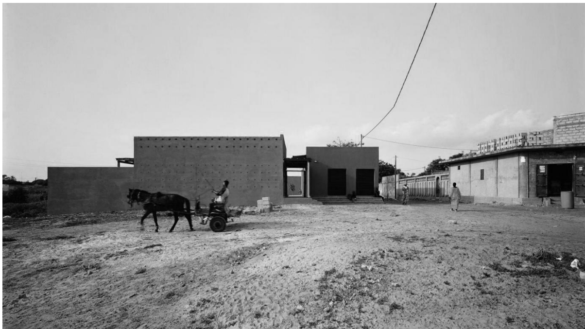
Nőközpont, Rufisque, Szenegál. Építészet: Hollmén Reuter Sandman Architects