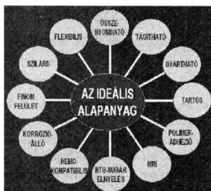
1. ábra A korszerű értágítóbetétek anyagaival szembeni elvárások

Ami a bevonatokat illeti, az arany, SiC, DLC, phosphorylcholine, polivinilpirolidin, polivinilalkohol, polietilén-tereftalát alkalmazása után különösen nagy figyelem összpontosult az ér visszaszűkülését (in-stent restenosis) helyi gyógyszerkibocsátással gátlása bevonatokkal ellátott értágítóbetétekre (DES).