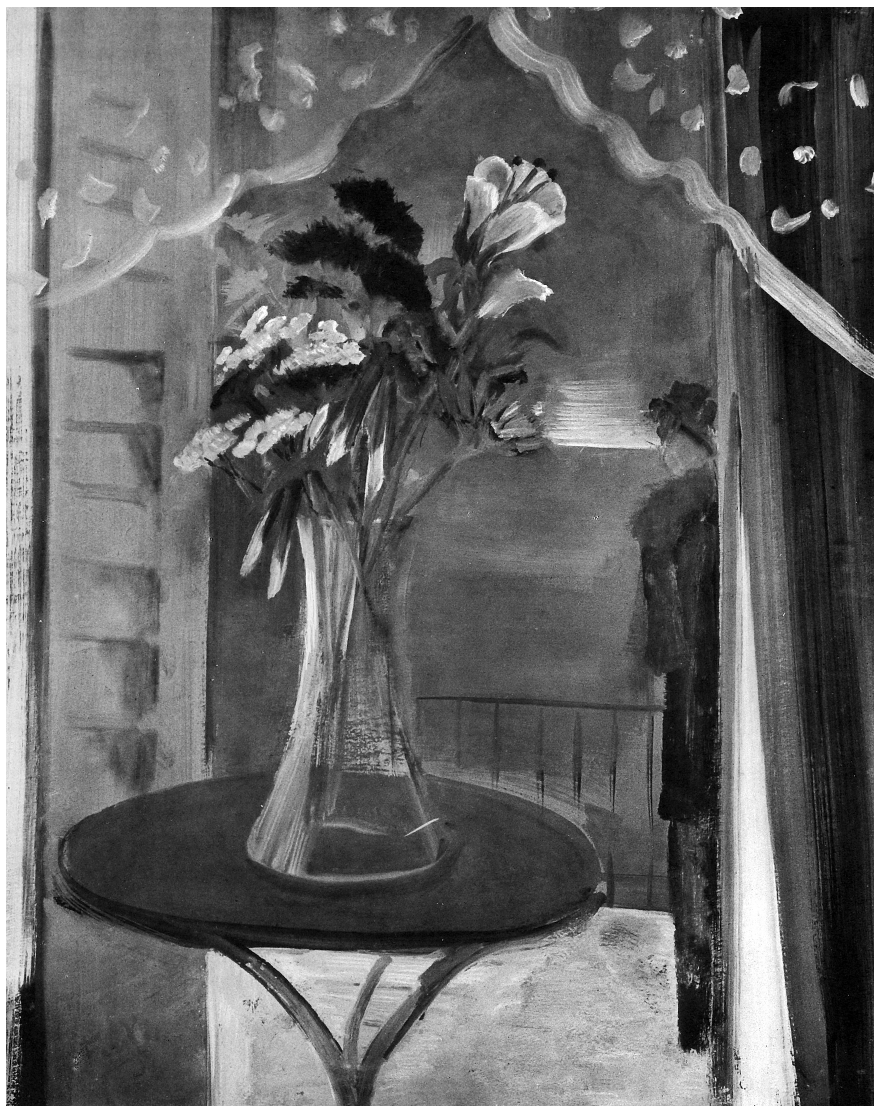
Farkas István: Virágok , 1934. tempera, fa, 100 x 80 cm. Mgt. Repr. André Salmon: Etienne Farkas . Paris, 1935. 5. Egykor Fruchter Lajos gyűjteményében, Budapest

művészt. Erre rácsfolna az a néhány akvarell-tanulmány, amely vízparti motívumok, gyümölcs s más efféle tárgy, aztán rajzolt aktok sorozatából áll. És kompozíciói is. Érezzük, hogy ilyesfélét valóban látott is a művész, csak hogy itt mindez tömörítve, egy lírai erőttől alakítva, mint szilárd egység kerül elénk. Ez az egység - a jó kép fontos tartozéka - ennél a művésznél körülményesség nélkül áll elő, úgy hat, mintha magától adódott volna. Ami bizony nem mindennapi sajátság. Fokozza ezt az