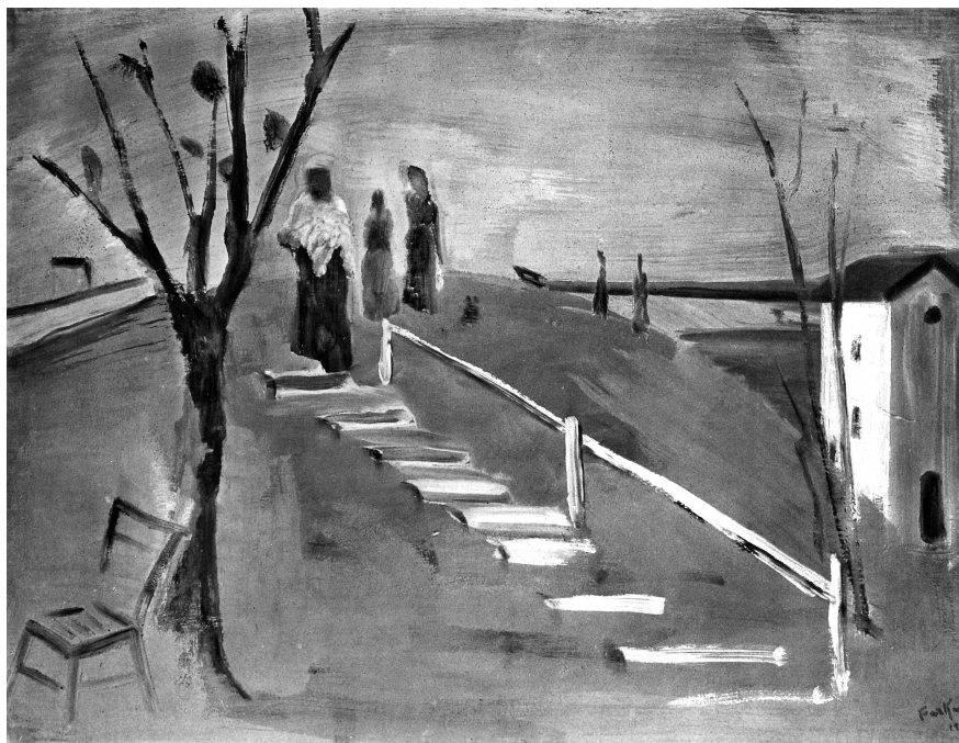
Farkas István: A dombon, 1931, tempera, fa, 65 x 81 cm, SZM – MNG, ltsz. 8609

mit fest. Farkas István nagy dologra vállalkozik. Nem a láthatót akarja kifejezni nekünk. Célkitűzése újnak tűnik, holott gondoljunk csak a középkorra, amikor láthatatlan emberi álmokat valósítottak meg művészek képzőművészeti alkotásokon. [...]