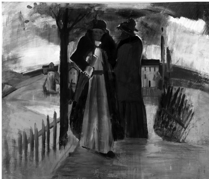
Farkas István: Vihar után, 1934. Tempera, fa, 115 x 136 cm

világvihar közepette is. Ha fárasztanak és gyötörnek is bennünket a háborús újsághírek, még mindig módunk van hozzá, hogy elolvassunk egy érdekes könyvet, meghallgassunk egy koncertet, melynek csodálatos ritmusai kizökkentenek a reménytelenség állapotából, vagy megnézzünk egy kiállítást, ahol a formák, színek és vonalak harmóniája deríti fel szívünket. Hangsúlyoznom kell, hogy a művészetek területén nálunk ma a festők és szobrászok munkálkodnak legintenzívebben és legfigyelemreméltóbb eredménnyel.