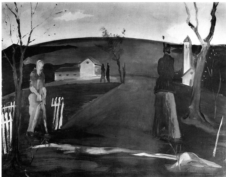
Farkas István: Este (Alkony, Soir), 1931, tempera, fa, 144 x 145 cm, Janus Pannonius Múzeum, Pécs, ltsz.: 68. 494. Repr. André Salmon: Etienne Farkas . Paris, 1935. 10.

és színezésük, továbbá a köréjük festett színek, a víz, az ég, a fű színe együttvéve kelti a nézőben azt az érzést, hogy ezeken a képeken a pusztá felületábrázolásnál több és egyéb van s hogy festőjükben gondolkodó és a lét fájdalmas problémaival együttérző ember él. Képein mindez nincsen szóval megfogható módon elmondva. A megindított képzelet megköetetlenül keresheti rajtok a rejtett értelmet és a ki nem mondott szándékot. Milyen rejtelmes festmény például az Elvégeztetett című. Valami asztalféle fekete alkotmányra, amely azonban Szent Mihály lova is lehet, rákönyököl egy asszony. A gyászoló közönségre emlékeztető mozdulattal áll az asztal körül egy férfi, meg két nő. Vibráló sárgás fénysugár vetődik a lehajló asszony és a három alakos csoport közé, alul pedig, a földön fantasztikus zöld fények játszanak. Mi történik ezen a képen? Nehéz eldönteni. Csak egy bizonyos: hogy aki jól megnézte, az valami megdöbbenést, valami szívvelszorítót érez, valami olyat, ami a tragikum őrzéséhez hasonló. Különös emberi alakok Farkas István képeinek szereplői. Egyhelyben állók, vagy ülők, egy bizonyos mozdulatban megrögzültek, részvétlenek, vagy fásultak, az élet elfáradottjai: szomorú emberek. Keszthelyi emlék egyik képe a címe, s háttérben a Balaton vize látszik. Az idő ősz eleje, a fák lombja rozdsaszínű. Elöl egy szikár öregasszony áll fekete kalappal és galléros fekete köpenyben. Arcából csak a