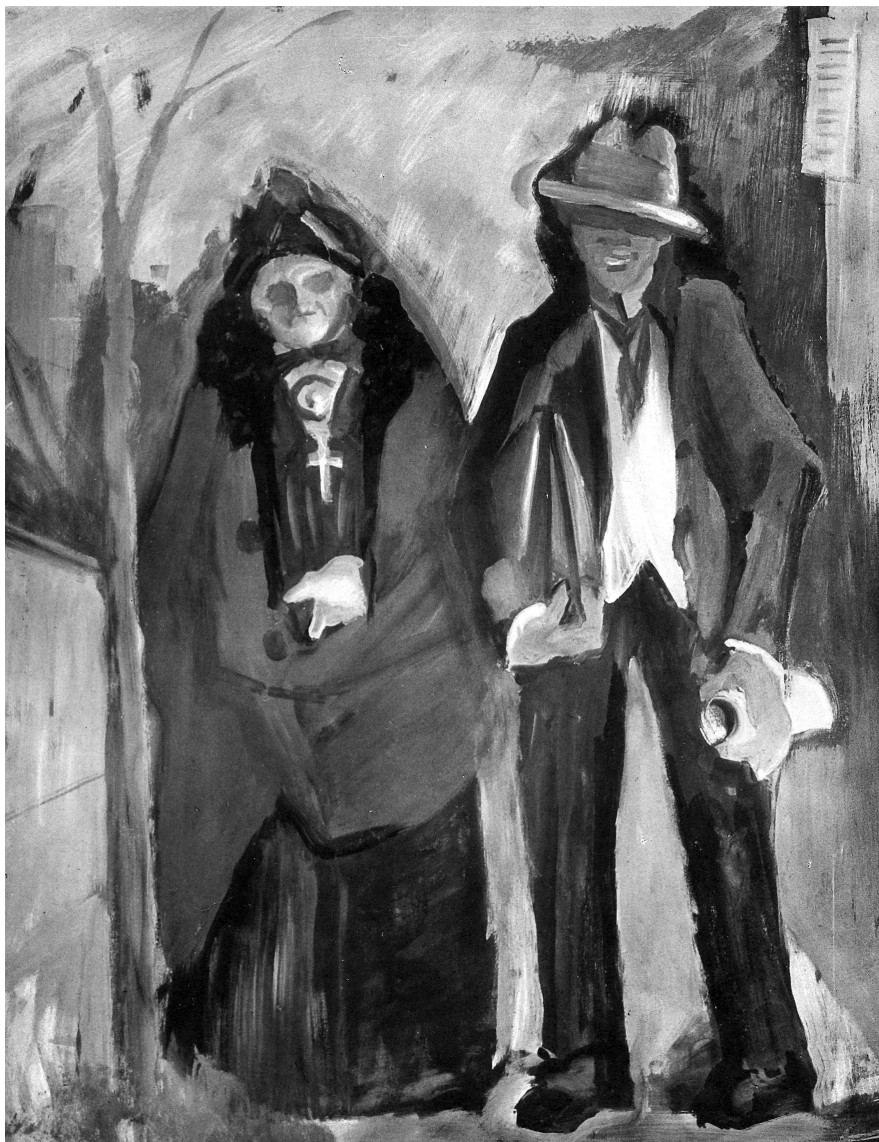
Farkas István: Fiatal részeg költő anyjával , 1932, tempera, fa, 145 x 115 cm, KKJM, ltsz.: 84.90. Repr. André Salmon: Etienne Farkas . Paris, 1935. 15.