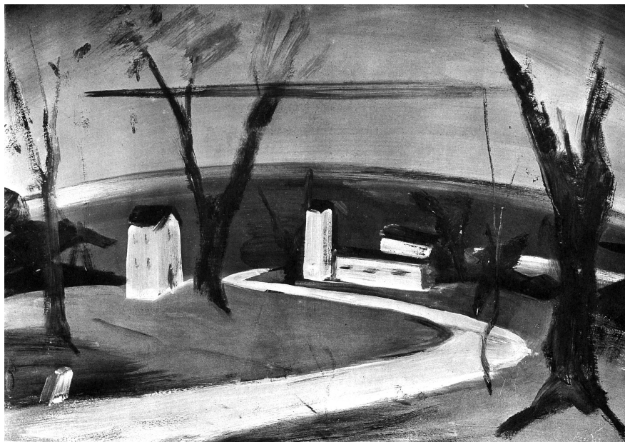
Farkas István: Lakatlan város, 1931. Tempera, fa, 46 x 65 cm, Türr István Múzeum, Baja, ltsz.: 69.103. Repr. André Salmon: Etienne Farkas . Paris, 1935. 9.

magukra letek festőink, saját formáikban és saját színkáláikkal szólnak. Farkas István ezek közé a nyugtalan és nyugtalanító egyéniségek közé tartozik. Közeli rokonát magyar viszonylatban nem is tudnám megnevezni. Semelyik csoporthoz, semelyik irányzathoz nem tartozik, bensőséges, olykor szinte már a misztikum felé hajló mondanivalói, színeinek fanyar, kesernyés és kénes íze külön helyet jelöl ki számára piktúránkban.