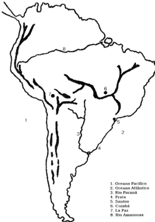
Figura 4 — Antagonismos geográficos sul-americanos (Mário Travassos)

Mário Travassos tudományos tevékenysége az 1930-as években indult. A tér és a hely nála is elismert és fontos fogalmak. Katona létére azonban nem részesíti előnyben a tekintélyelvű gondolkodást és az autoritárius jellegű, centralizált politikai berendezkedést. Ami elsősorban foglalkoztatta, az Brazília szerepe a latin-amerikai kontinensen, az Atlanti-óceán és a Csendes-óceán vonzáskörzetének brazil szempontú hatalmi összekapcsolása, a La Plata és az Amazonas folyók térségének uralmi viszonyai. A Miyamoto Shiguenoli által közölt 4. számú ábra szerint Mário Travassos Dél-Amerikában nyolc tengely mentén felvázolható kontinentális földrajzi antagonizmusról beszél. Ezek: 1. A Csendes-óceán; 2. Az Atlanti-óceán; 3. A Paranáy-folyó; 4. A La Plata-folyó, 5. Santos városa; 6. Cuiabá térsége; 7. La Paz körzete; 8. Az Amazonas-folyó medencéje között diagnosztizálható feszültségek.