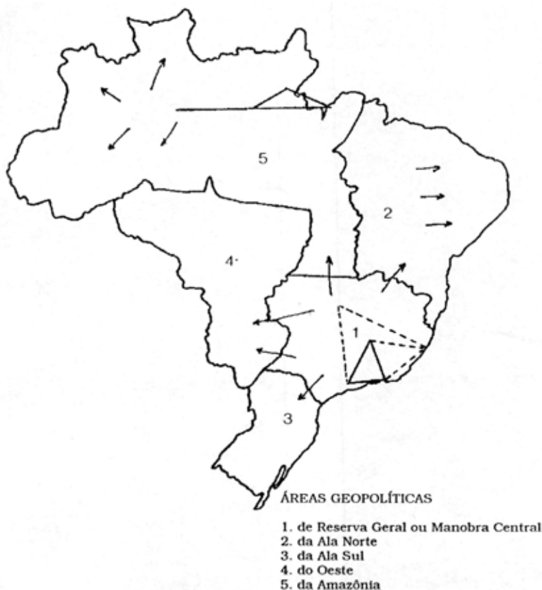
Figura 8 — Esquema geopolítico de Golbery do Couto e Silva (Adaptado de Golbery do Couto e Silva 1967)