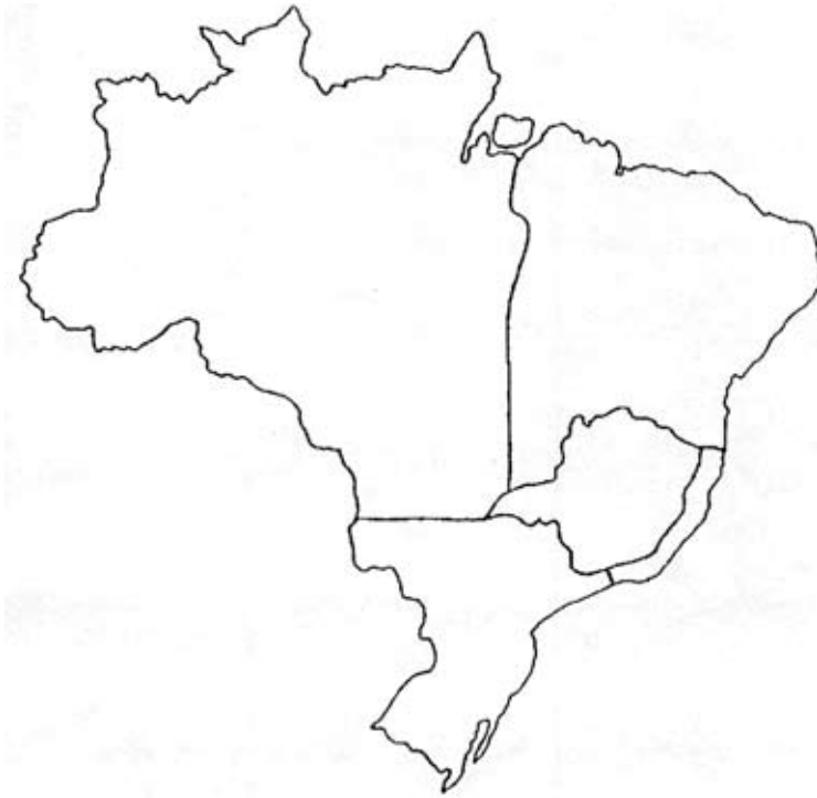
Figura 6 — Estrutura geomilitar do Brasil (Mário Travassos)

Golbery do Couto e Silva 1967-ben megjelent, 1981-ben ötödik kiadást megért Geopolítica do Brasil című klasszikus művében az ország geopolitikai térségeit Mário Travassos Brazília geomilitáris szerkezetét bemutató ábrája alapján készítette el.