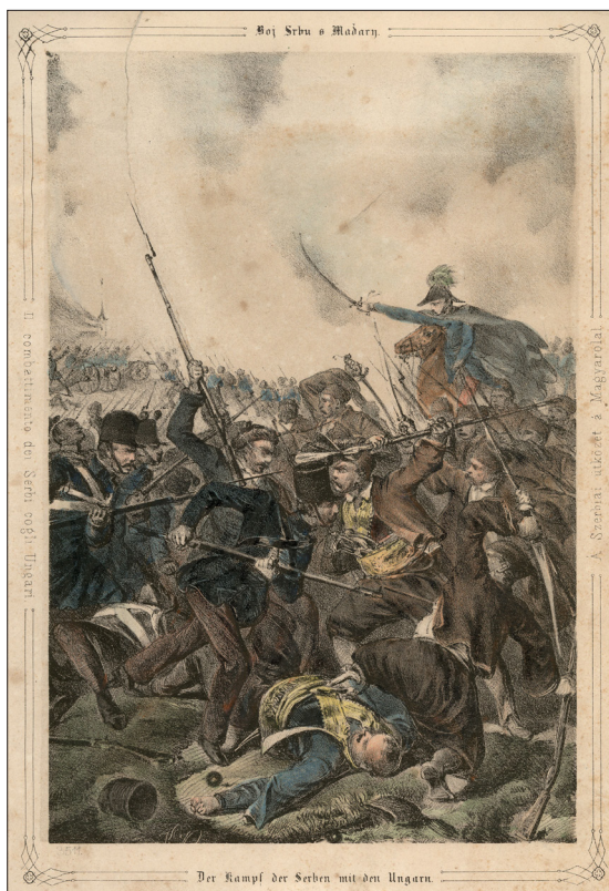
2. ábra Magyarok és szerbek harca, 1848