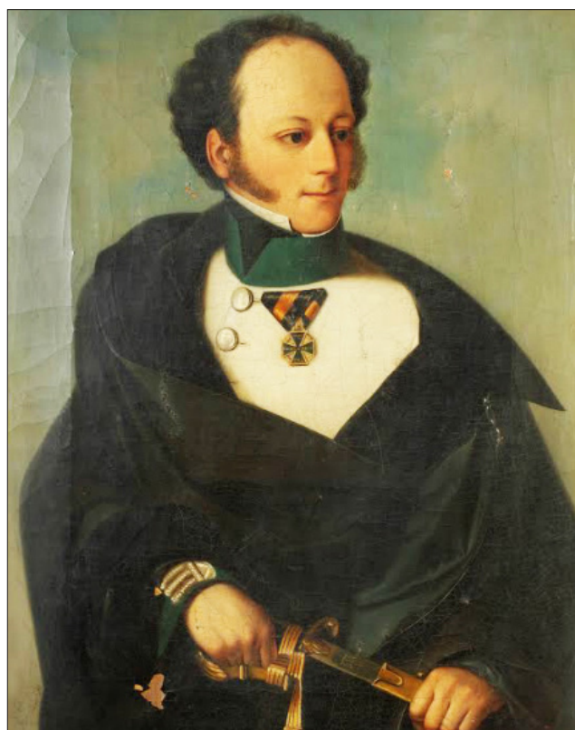
3. ábra Maderspach Ferenc (1793–1849)