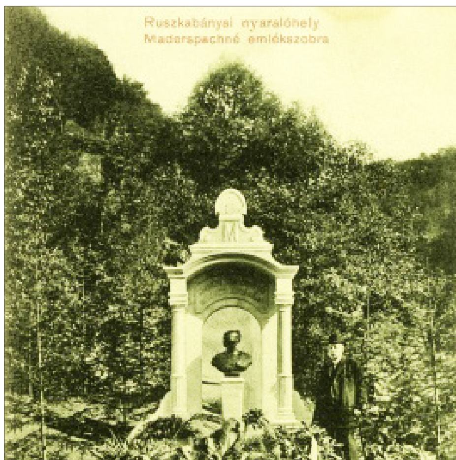
4. ábra Maderspach Károlyné (1804–1880) szobra