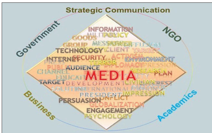
2. ábra. A stratégiai kommunikáció eredet-vizualizációja (2015) 14

A 3. ábrán jól látható, hogy a a politikai és a katonai területek találkozását említhetjük oly módon, hogy azokban megjelennek olyan speciálisnak mondható szakterületek, mint a politikai marketing, a propaganda, a pszichológiai (lélektani) hadviselés/műveletek, vagy