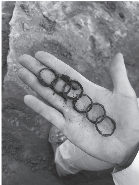
8. kép: Egymásba fűzött szarmata kori bronzkarikák (Szeméttelép I.)

Szintén a körforgalomtól délre, az Ipari Park területére esnek a Gyékényes II., III., IV. lelőhelyek. Térségükben szűkül össze a Zagyva-völgy: az ármentes magaspart kiszélesedik, pereme délnyugati irányba húzódik, helyet adva annak a területnek, ahol a mai település létrejött. A homokvonulatok ÉNy–DK irányt vesznek fel, amelyeket szikes legelők és mélyen fekvő, vizenyős területek tagolnak és határolnak kelet felől. Mindhárom többkorszakos lelőhelyen több régészeti tevékenység zajlott az elmúlt években az ipari beruházásokhoz kapcsolódóan, amelyek során szarmata kori telepek és temetők is előkerültek.