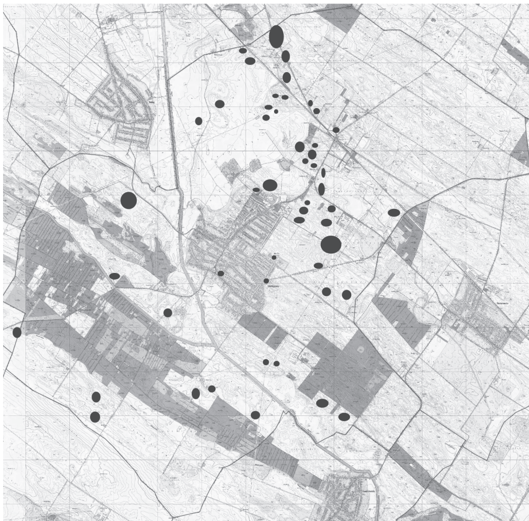
1. kép: A szarmata kori lelőhelyek vázlatos elhelyezkedése Jászfényszaru területén