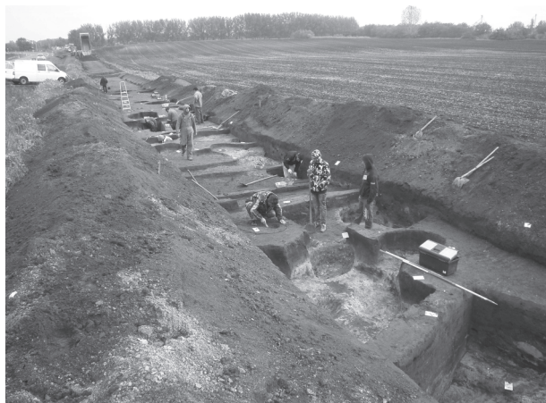
7. kép: Településrészlet feltárása keskeny nyomvonalon (Pipis-halom)

A Pipis-halom a következő nagy kiterjedésű lelőhely, amely a települést északról