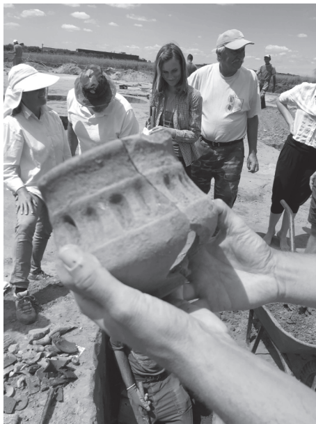
9. kép: Látogatás az ásatáson (Szeméttelp I.)

A települési jelenségekből előkerült kerámiaanyag pontosabb keltezésre nem alkalmas, de biztosan szarmata kori. Ezt már Patay Pál kutatócsoportja is megállapította; a leletanyagot ma is hasonlóképpen értékelhetjük. Az is ma még megállja a helyét, hogy az anyag általánosan elterjedt formái között nincs olyan, amely kifejezetten késő szarmata kori lenne. A feltárás során számos edénytöredéket találtak a feltöltésben, az elszántott védmű területén: köztük már akadnak olyanok, amelyeket inkább a késő szarmata korra keltezhetünk. 58 Ezek azonban a sánc keltezésére közvetlenül nem használhatók fel.