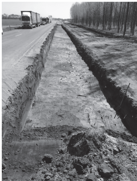
6. kép: Lehumuszott településrészlet a kézi bontás megkezdése előtt (Nagy-Bika-halom I.)

Az 1969-ben feltárt anyag közöletlen. 16 A Rókalyukak és Nagy-Bika-halom környékén számos kurgán nyilvántartott, amelyeket a mezőgazdasági művelés folyamatosan pusztít. A kurgánok védelmét, művelésből való kivonását régóta szorgalmazzák, főként azóta, hogy Kolozs István 1996-ban elszántott emberi csontmaradványokat talált az egyik helyszínen. A kurgánok rézkoriak lehetnek, amelyekre a római korban rátelepültek; de esetleg egy nagyobb szarmata kori halomsíros temető is húzódnak a területen.