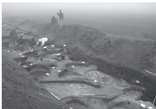
11. kép: Pipis-halom szarmata települése bontás közben

A Galga-torkolattól délre, a Zagyva jobb partján, a folyó kanyargó ősmedrei mentén számos régészeti lelőhely található. Folyóvízi homokon és futóhomokos kiemelkedéseken létesültek. Pandalos, Csonthalmi-tanya lelőhelyen szarmata telep és valószínűleg temető is húzódik. Szarmata települések nyomai találhatók három további közeli lelőhelyen, amelyek