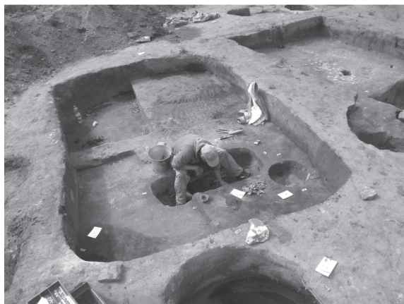
5. kép: Épületjelenségek finombontása (Hatvani-határ)

Egy-egy temetőben gyakran hosszú időn keresztül temetkeztek, de a sírok a nagy mértékű fosztogatás és az anyagi kultúra nagy mértékű folytonossága miatt nehezen keltezhetőek. A szarmata sírokból többnyire