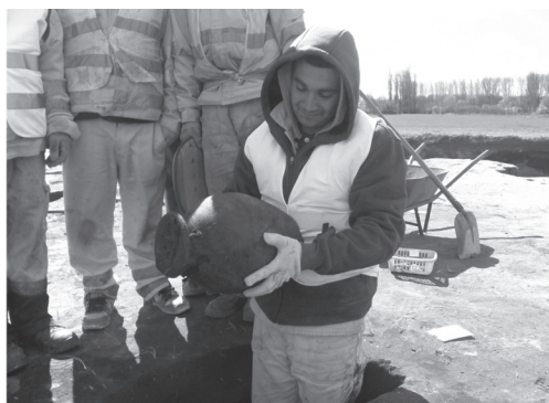
12–13. kép: Szarmata edény kiemelése (Hatvani-határ)

A Gepida Királyság konszolidálódása, az alföldi gepida anyagi kultúra kialakulása néhány évtizedig eltartó folyamat lehetett. A jászsági hun kori leletek a tiszántúli gepida lelőhelyeken alig rendelkeznek párhuzamokkal: azoknál jellemzően korábbra keltezhetők. Ezért ezeket a leleteket nem köthetjük egyértelműen a gepidákhoz, sem semmilyen, az írott forrásokban szereplő népcsoporthoz. Az 5. század végére és 6. század első felére keltezhető régészeti anyagot nem ismerünk a Jászságból. A gepida korban, az első avar népcsoportok érkezéséig a térség lakatlannak tűnik.