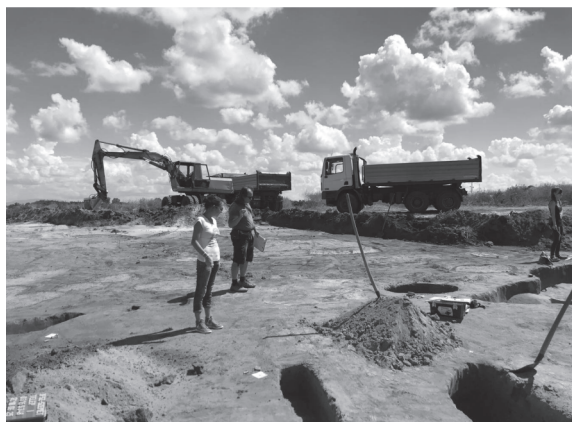
10. kép: Szeméttelép I. lelőhely megelőző feltárása

Fényszaru alatt, a Galga-torkolattól délre a Zagyva-völgy erősen összeszűkül. A káta határ felé eső futóhomokos területek jelentős részén erdő húzódik. A terméketlen homoknak tartott területen alig ismerünk régészeti lelőhelyet. Annál több sorakozik a