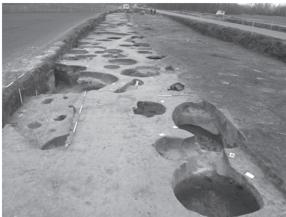
3. kép: Településrészlet feltárása a nyomvonalas szelvény bővítése közben (Hatvani-határ)

A 32-es számú főút szélesítése és megerősítése miatt az út mentén nagyszabású régészeti munkálatok zajlottak 2014–2015 folyamán. Az MNM Nemzeti Örökségvédelmi Központ (2015-től az MNM) munkatársai számos lelőhelyet kutattak meg. A megelőző régészeti feltárások előtt a helyszíneket adatgyűjtéssel és terepbejárással azonosították, majd geofizikai kutatásokat és próba-feltárásokat végeztek. Az eredményeket a beruházás régészeti érintettségét áttekintő Előzetes Régészeti Dokumentációban összegezték. A beruházással veszélyeztetett lelőhelyrészek teljes megelőző feltárása, ill. régészeti megfigyelése 2015-ben zárult le. (3. kép)