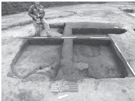
4. kép: Épület dokumentációja bontás közben (Hatvani-határ)

A szarmata temetőben a körárkos–halmos temetkezések között általában további