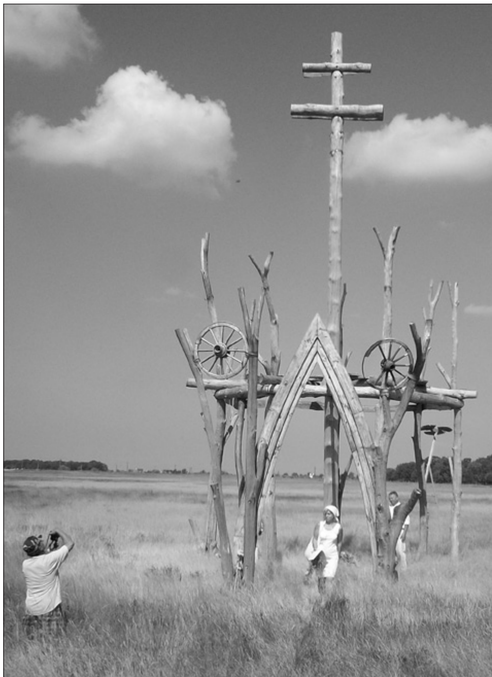
7. kép: Boldogasszony Ünnep a Hétboldogasszony Hajléka Kápolna maradványainál, Bösztörpuszta (2013)