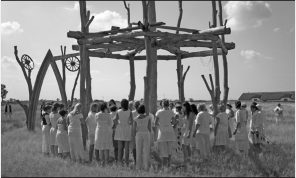
8. kép: Boldogasszony Ünnep a Hétboldogasszony Hajléka Kápolna maradványainál, Bösztörpuszta (2013)