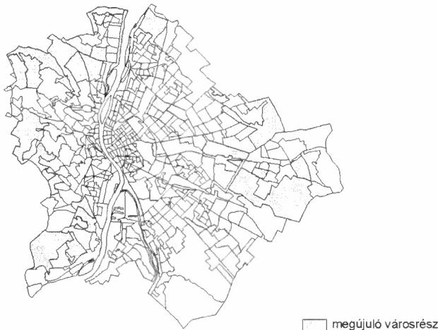
Budapest megújuló városrészei 1990–2001 (Upgrading Neighbourhoods in Budapest, 1990–2001)