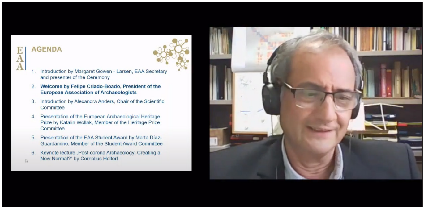
2. kép. Képernyőkép a megnyitó ünnepségről

repe is hangsúlyosabbá vált. Ezt jól jelzi az is, hogy számos szervező határozott úgy, hogy szekcióját törli vagy halasztja a következő évekre. 180 előadó ezekből a megszűnt szekciókból mégis úgy döntött, hogy mindenképpen szeretne részt venni előadásával vagy poszterével a konferencián. A Tudományos Bizottság feladata volt, hogy ezekből az előadásokból tematikus csoportokat szervezzen és levezető elnököt is delegáljon ezekhez a szekciókhoz (#s500–519).