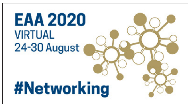
1. kép. EAA 2020 VAM logo

Értelemszerűen ez a konferencia a már korábban kialakított tudományos keretek közt zajlott – megőrizte a jelmondatát: Networking , melyhez új logó társult ( I. kép ), nem változott az időpont, megmaradtak a fő témák és a hozzájuk kapcsolódó díszelőadások, valamint a Tudományos Bizottság tagjainak jelentős része is döntött, hogy folytatja munkáját és támogatja minden erejével a VAM sikeres megvalósítását. Az EAA éves találkozóinak egyre növekvő sikerének egyik oka az, hogy az emberek szeretnek egymással találkozni, ismerkedni, beszélgetni, vitatkozni, közösen felfedezni új helyeket a világban, együtt kávézni, sörözni, borozni, táncolni, és hosszan lehetne még folytatni. A VAM mindezekre az elvárásokra nem, vagy csak korlátozottan tudott lehetőséget biztosítani és így a találkozó tudományos sze-