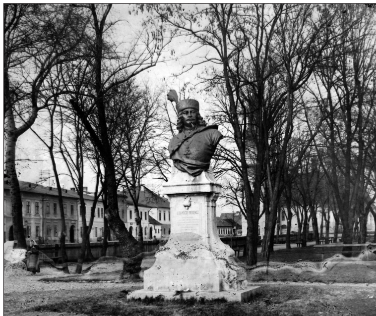
1. kép. A zólyomi Rákóczi-szobor, 1907

Az avatási ünnepséget megelőzte egy előzetes ceremónia (1. kép). 25 Május 27-én a szobor talapzatába egy fémtokban elhelyezték a keletkezésének történetéről szóló iratot, 26 továbbá az akkori pénznekem és a mozdonyvezetők utolsó lapjának egy-egy példányát, valamint egy listát, amely a szobor felállítására adakozó vasutasok nevét és az adományozott összegeket tartalmazta. 27 Az okirat elhelyezésénél megjelent Skvorina Mátyás, Zólyom város polgármestere, a város korábbi főjegyzője, Petheő Tivadar, a zólyomi szoborbizottság összes tagja, valamint „nagy-számú közönség”. 28 Ezekben a napokban kiderült, hogy a zólyomiak joggal számíthatnak országos jelentőségű szoboravatóra, mivel Magyarország minden pontjáról 137 egylet jelezte május 29-én, hogy képviselőket küld, ami egyetlen nap alatt 360-ra nőtt. Úgy tűnt, a hajdúsági Bocskai-szoboravatót teljesen elhomályosítja a zólyomi Rákóczi-mellszobor leleplezése. Kilátásba helyezte részvételét Kossuth Ferencen és Justh Gyulán kívül gróf Apponyi Albert kultuszminiszter és Jekelfalussy Lajos honvédelmi miniszter is – utóbbi a zólyomi választókerület országgyűlési képviselője is volt –, valamint legalább 15 felsőházi képviselő. 29 Június 1-jén azonban kiderült, hogy az országgyűlés sokkal fontosabb – vagy, mint látni fogjuk, politikailag kevésbé kockázatos – eseménynek minősítette a hajdúböszörményi szoboravatót, ezért ott jelentek meg a legfőbb potentátok. Olyannyira, hogy például még a Rákóczi-