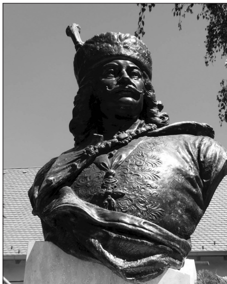
2. kép. A Zólyomban 1907-ben leleplezett Rákóczi-szobor ma Borsiban

A Brassói Magyar Újság című napilap 1907. október végén a következő csalódott híradást tette közzé: Marosvásárhelyen „Holnap délelőtt leplezik le II. Rákóczi Ferencnek, a halhatatlan emlékű erdélyi fejedelemnek a mellszobrát. Talán nagyobb ünnepség és pompa illette volna meg ezt az ünnepséget, mert ez a szobor Erdélyben még csak az első és széles hazában a második emlékmű, mely a fejedelem nagyságát és dicsőségét hirdeti. Talán mégsem kellett volna ennek az ünnepélynek kizárólag helyi jellegűnek lennie. El kellett volna terjedjen a híre, hogy Erdély szabad népe milyen fénnel ünnepli a szabadság lánglelkű harcosának dicső emléket.” 58 A várva várt esemény – noha országos jelentőségű társadalmi-politikai megmozdulásként indult, mint minden ilyen jellegű kezdeményezés az 1903-as évfordulót követő időszakban – valóban nem váltotta be a hozzá fűzött reményeket, mivel jócskán megkésett (négy évig készítették elő).