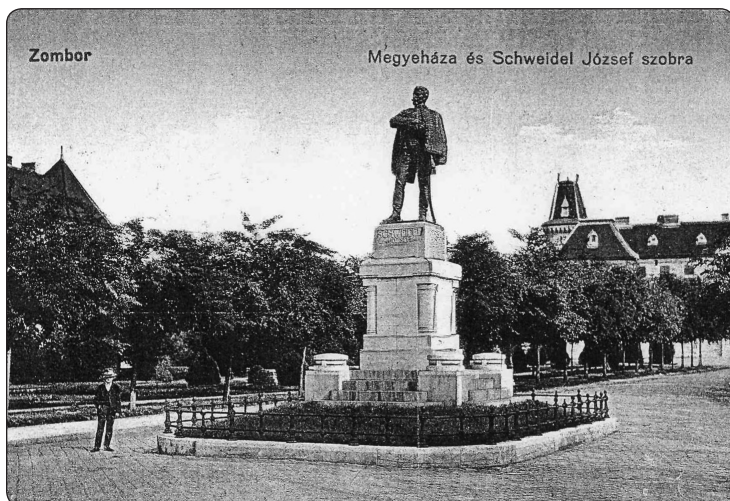
4. kép. A zombori Megyeháza tér a Schweidel-szoborral egy korabeli képeslapon

utóbb a társadalmi kötelezettségek nagymértékű megszaporodásával magyarázta. 109 Mindenesetre a jegyző állítása szerint – a hírlapi tudósításnak ellentmondva – 1910 őszére közel 20 ezer korona gyűlt össze, s 3000 az ünnep megrendezésének költségeire. 110 Nem tudjuk pontosan, mi történt, de a pénzalapot néhány nap alatt majdnem a duplájára tornázták fel, s talán nem járunk messze az igazságtól, ha feltételezzük, hogy a lokálpatrióták ekkor szánták el magukat nagyobb összegű adományaik befizetésére. Ugyanis, ha megnézzük a befolyt összegek kimutatását, valamint a befizetők nevét, 111 kiderül, hogy a helybéli politikusok, közszereplők, birtokosok fizették be a legnagyobb összegeket az alapba, s nem a gyűjtés kezdetekor, hanem annak lezárulta előtt néhány héttel.