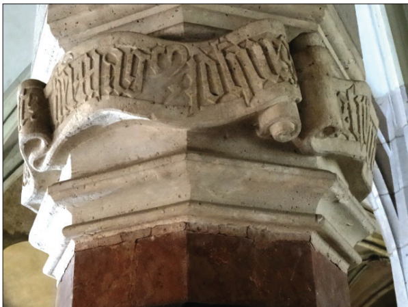
A vajdahunyadi (Hunedoara, Románia) vár földszinti nagytermének 1452-es évszámú, feliratszalagos oszlopfejezete a felirat fi(e)r)i mag(nifi)^(us) Job(a)nes részletével