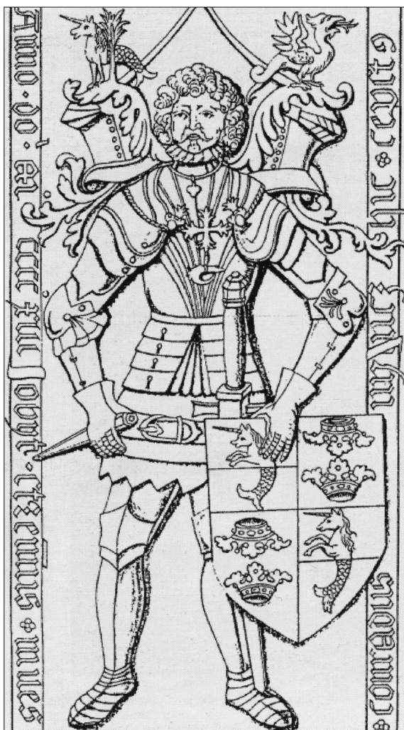
Konrad (II.) von Nimptsch (†1446) elveszett tumbafedlapja, egykor a sziléziai Swidnica (Schweidnitz) ferences templomában (W. E. Seidlitz által 1745-ben közölt, 1725 előtt készült rajz alapján készült metszet, itt Czechowicz, B.: Nagrobki późnogotyckie na Śląsku i. m. 21. kép nyomán)