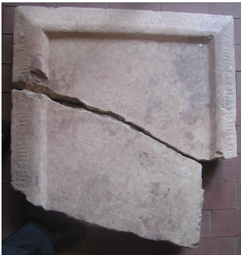
Margit töredékes síremléke a nagyváradai (Oradea, Románia) várból, 1430–1440 körül