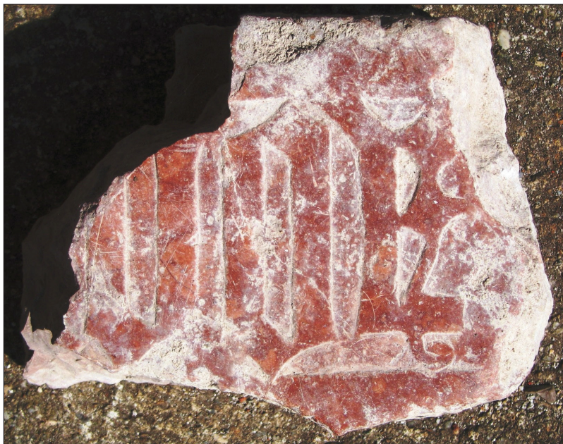
Sírkőtöredék a nagyváradai (Oradea, Románia) várból, 15. század második negyede