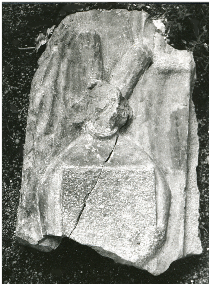
Angyalt ábrázoló, befejezetlen töredék a budai Mária Magdolna-plébániatemplom feltárásából (Budapest, Magyar Nemzeti Galéria)