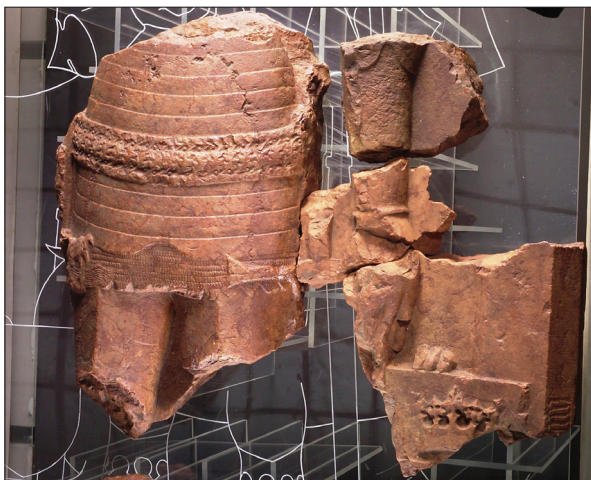
Bosnyák király Bobovac várában talált síremlékének töredékes fedlapja, törzstörődék (Sarajevo, Zemaljski muzej Bosne i Hercegovine)