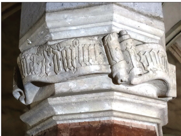
A vajdahunyadi (Hunedoara, Románia) vár földszinti nagytermének 1452-es évszámú, feliratszalagos oszlopfejezete a felirat a(nn)° d(omin)i m(illesim)° cccc° l ii részletével