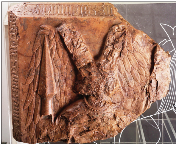
Bosnyák király Bobovac várában talált síremlékének töredékes fedlapja, angyal alakjával (Sarajevo, Zemaljski muzej Bosne i Hercegovine)