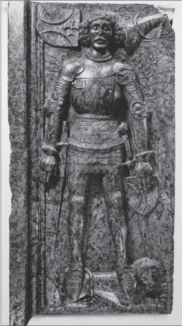
Stiborici (II.) Stibor (†1434) síremléke a budai Nagyboldogasszony-templomból (Budapesti Történeti Múzeum)