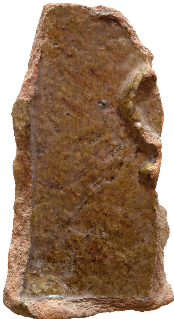
4.1. ábra. Zsigmond-kori kettős farkú cseh oroszlánt ábrázoló kályhacsempe töredéke.