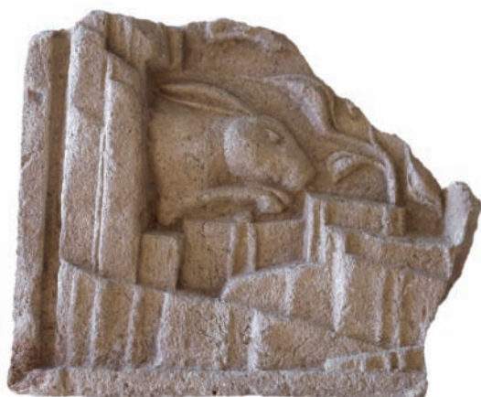
1. ábra. Zsigmond-kori mesejelenetes kályhacsempe töredéke.