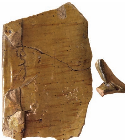
8. ábra. Zsigmond-kori áttört előlapú, aszimmetrikus mérműdíszítésű, élbefutó mérmű profilú kályhacsempe töredéke.