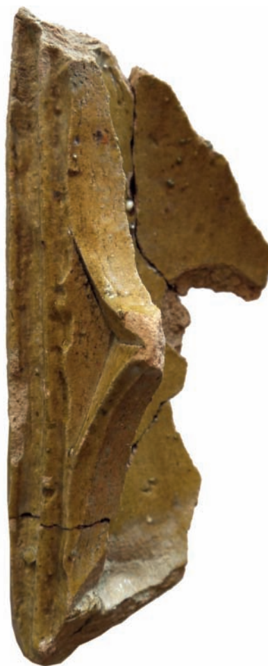
7. ábra. Zsigmond-kori áttört előlapú, négykaréjos, élbefutó profilú mérműves kályhacsempe töredéke.