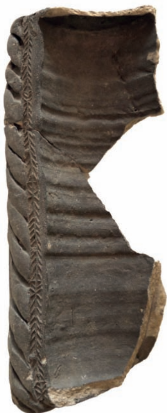
13. ábra. Szürke, redukált égetésű kályhaszem töredéke.