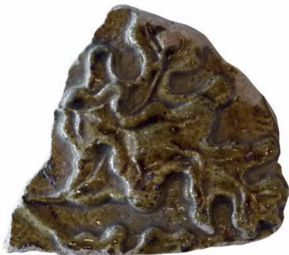
3. ábra. Zsigmond-kori mesejelenetes kályhacsempe töredéke.