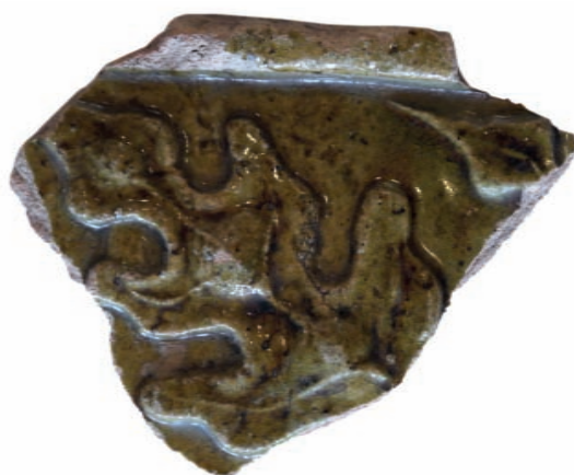
2. ábra. Zsigmond-kori mesejelenetes kályhacsempe töredéke.