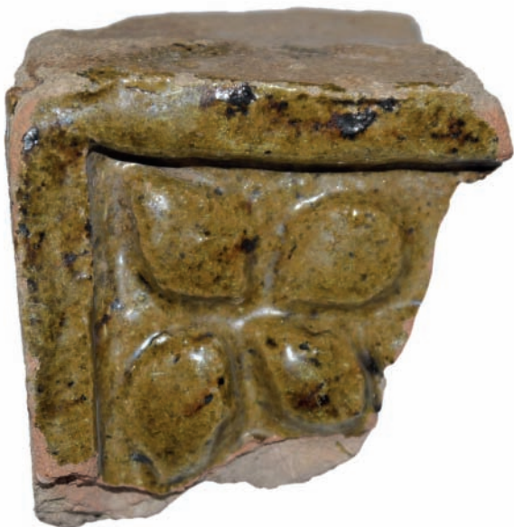
6. ábra. Zsigmond-kori szőlőfürtös és indás kályhacsempe töredéke.