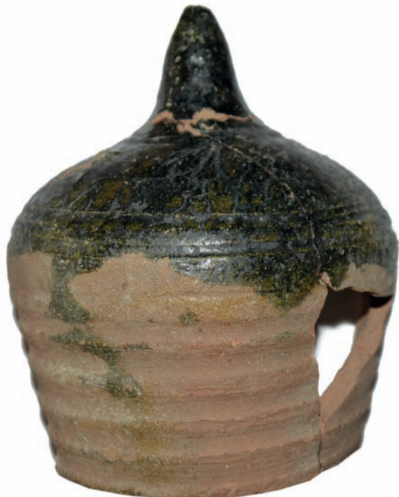
12. ábra. Zsigmond-kori mázas, hagyma alakú kályhaszem töredéke.