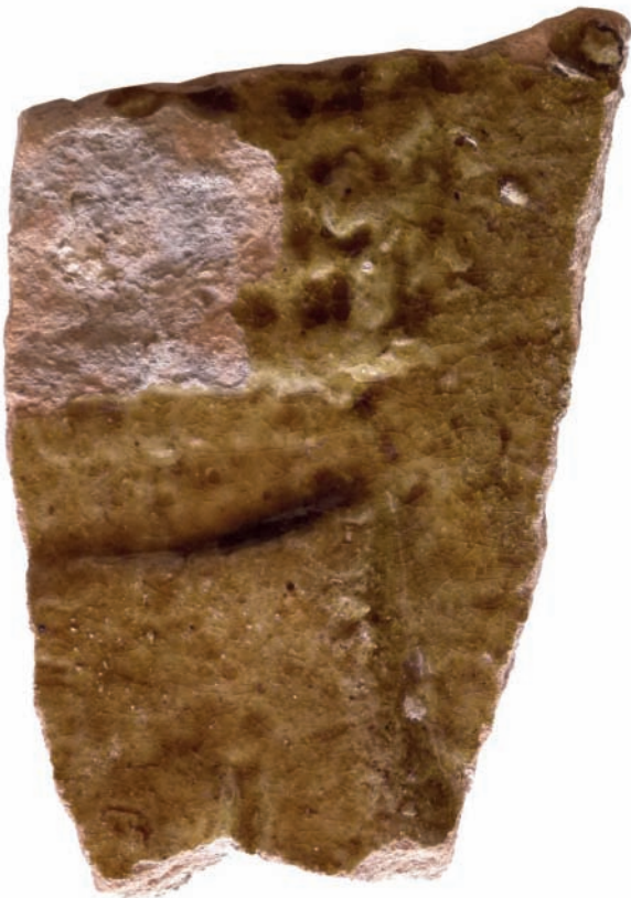
9. ábra. Zsigmond-kori címerábrázolásos kályhacsempe töredéke.