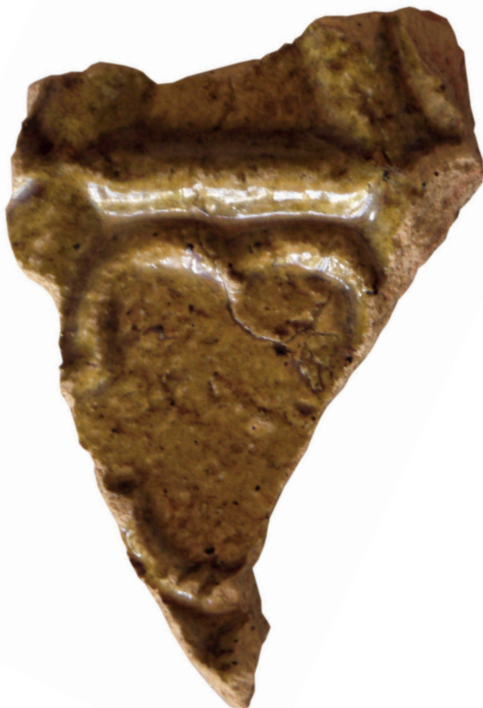
11. ábra. Zsigmond-kori zárt előlapú vakmértűves kályhacsempe töredéke.