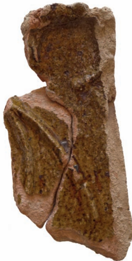
10. ábra. Zsigmond-kori zárt előlapú vakmértűves kályhacsempe töredéke.