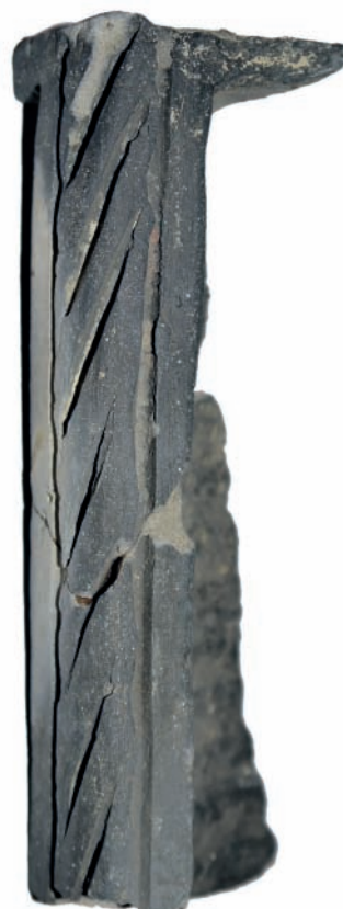
14. ábra. Szürke, redukált égetésű kályhaszem töredéke.

mely elmosódott lenyomatú csempéjükön is –, sőt egyes negatívokat időközben újrafaragott darabokkal pótolhattak. A műhely negatívkészlete folyamatosan gyarapodott is: az idők folyamán az uralkodó újabb címer változatai tűntek fel, egyes darabokon a Sárkány Lovagrend jelvényét is ábrázolták, sőt már a királyhoz közelálló főurak (pl. Eberhard zágrábi püspök, 23 Cillei család) címerábrázolásai is felbukkantak a csempék előlapján. Az elterjedési kör a királyi központok mellett (azokat is beleértve), nagyjából a Dunántúl északi felére terjedt ki. Az eddig ismert csempék lelőhelyei a következők: