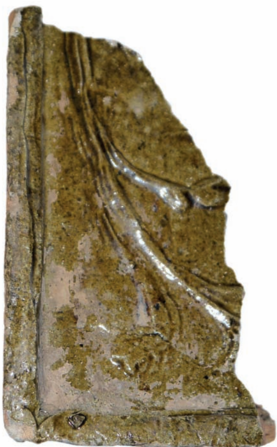
5. ábra. Zsigmond-kori sárkányrendes ábrázolású kályhacsempe töredéke.