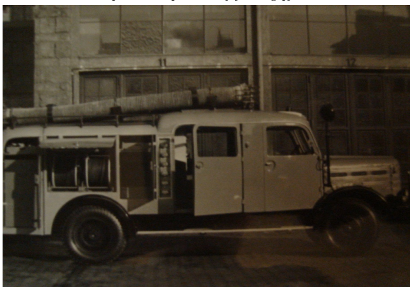
Csepel D-420 típusú áramfejlesztő gépjármű.