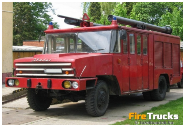
Csepel D-344 típusú gépjárműfecskenő.