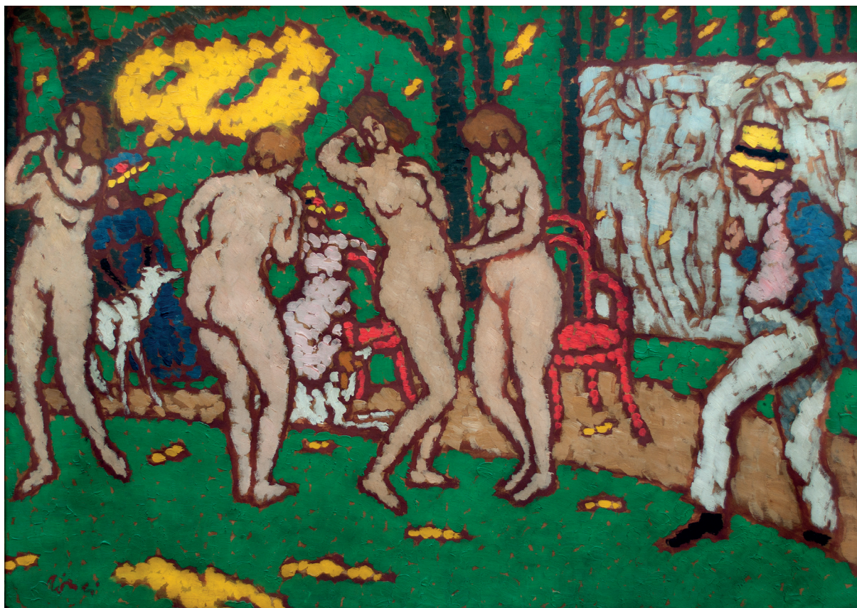
10 ábra. Rippl-Rónai József: Modelljeim kaposvári kertemben , 1911, olaj, karton, 70x100 cm, Rippl-Rónai Múzeum, ltsz.: 81.8.1.

lat és az idillikus természet szinte kínálkozik a festészen keresztül történő megragadásra. A fotóról hiányoznak a művész előtt mitológiai nimfákként pózoló aktmodellek, amelyek a festmény lényegi motívumai. Noha a festmény fotóból átemelt, konkrét elemekből épül fel, mégis metaforikus-szimbolikus tartalmakat közvetít. Horváth János a kép a képben motívumot vizsgálva a festményen felvázolt, készülő műalkotást egy másik világra nyíló ablakként értelmezi és anyagságtól elvont, idealizált állapotként írja le a motívumot. 46 Révész Emese Bacchus kertjeként értelmezi a képet, amely az ideális szépséget szemlélő művésztől illetve művészet teremtő erejéről szól. 47 A jelenet kedves humorral utal az ókori mitológiai istennők közül választó Parisra, akinek szerepébe ezúttal a festőművész kerül. A kibővített jelenet mindkét értelmezésben egy művészi vágyvilág megvalósítása: a festőművészetre utaló motívumokkal (aktok, festőállvány a készülő képpel és a maga a művész) egy figurára és tájra vonatkoztatott eszményigény megfogalmazása (10. ábra).