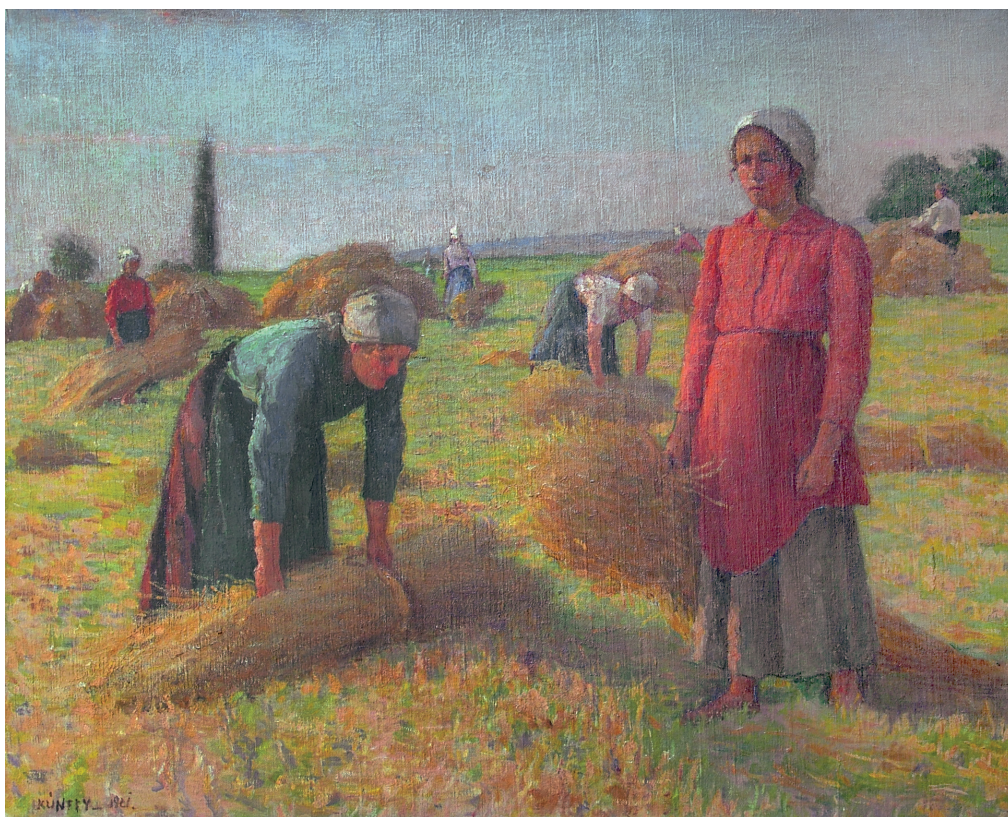
2. ábra. Kunffy Lajos: Kévehordók (Aratók) , 1921. vászon, olaj, 80x100 cm, Rippl-Rónai Múzeum, Ltsz: 64.92.