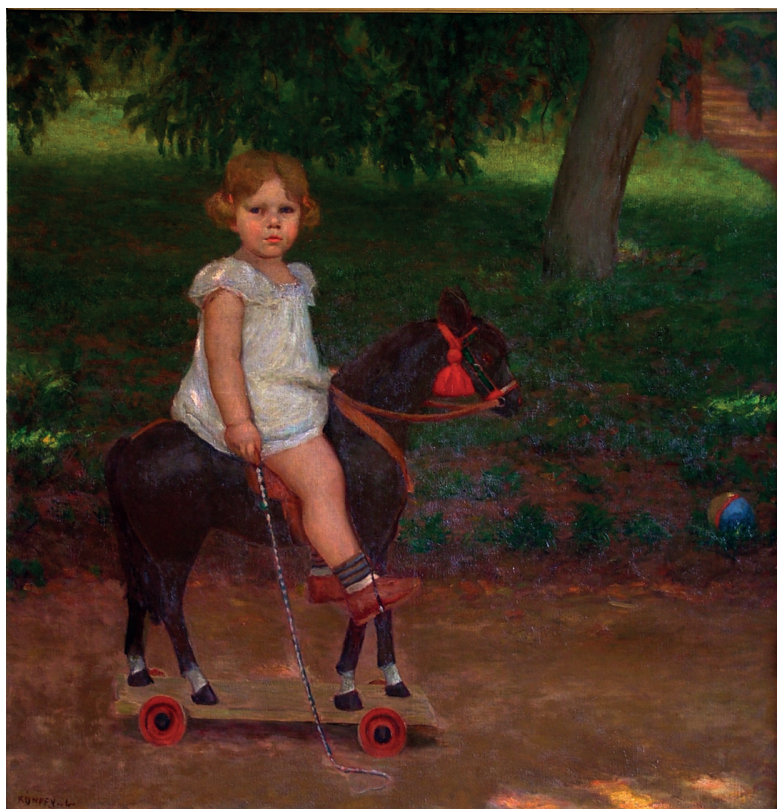
1. ábra. Kunffy Lajos: Fiam hintalovon , 1905. vászon, olaj, 131x130 cm, Rippl-Rónai Múzeum, Ltsz: 64.230.