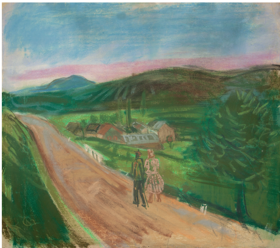
5. ábra. Bernáth Aurél: Országúton (Kaposvári táj) papír, pasztell, 50x57 cm, Rippl-Rónai Múzeum, ltsz.: 87.2.1.

zendő tradíciójának fő elemeként jelent meg 23 A szokásrendek Kunffy Lajos társadalmi együttműködést ábrázoló népi világának is részei: a lakodalom vagy az aratóünnep különösségéi egyben egzotikus sajátosságát is adják e világnak.