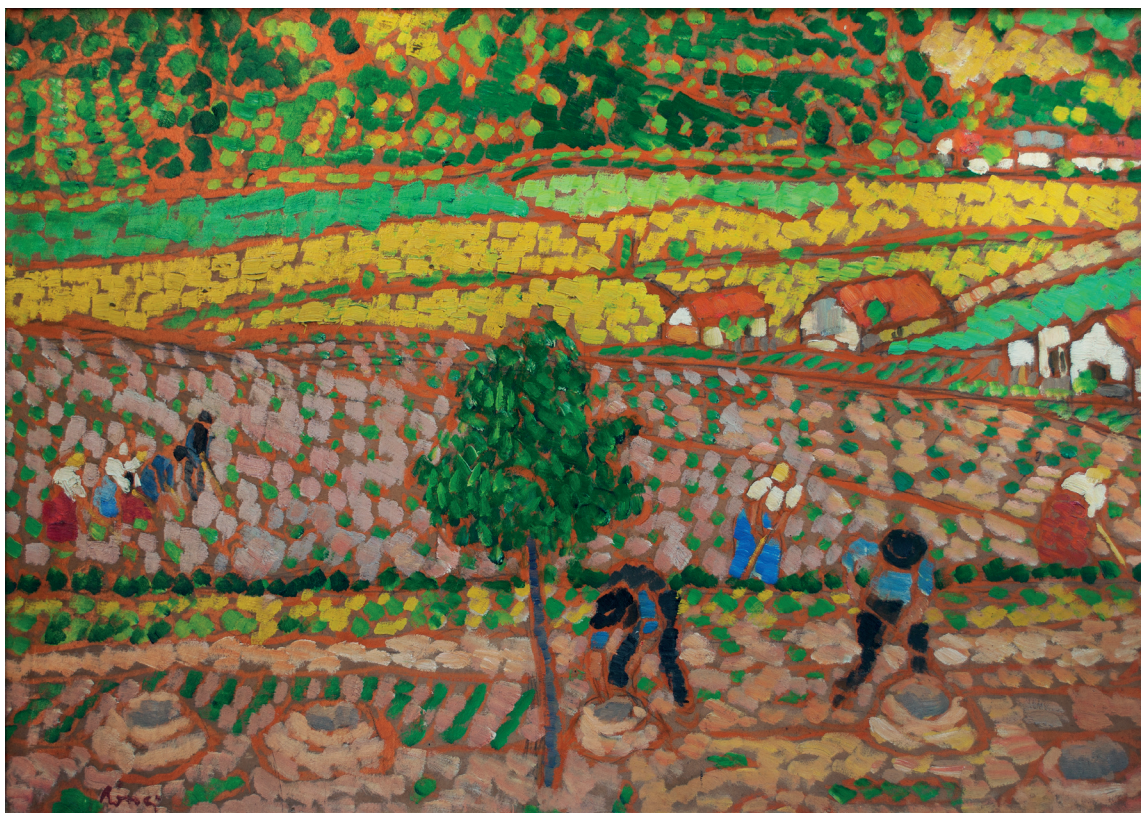
8 ábra. Rippl-Rónai József: Tavaszi munkák, 1912. olaj, karton 70x100 cm, Rippl-Rónai Múzeum, Lsz.: 63.4.