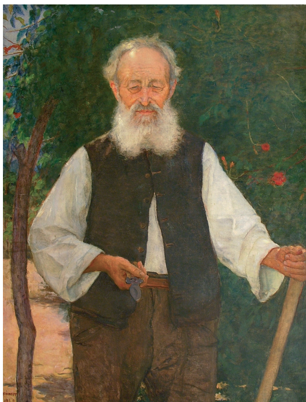
4. ábra. Kunffy Lajos: A látrányi kertészkedő tiszteletes, 1925. vászon, olaj, 116x90 cm, Rippl-Rónai Múzeum, ltsz.: 55.499.