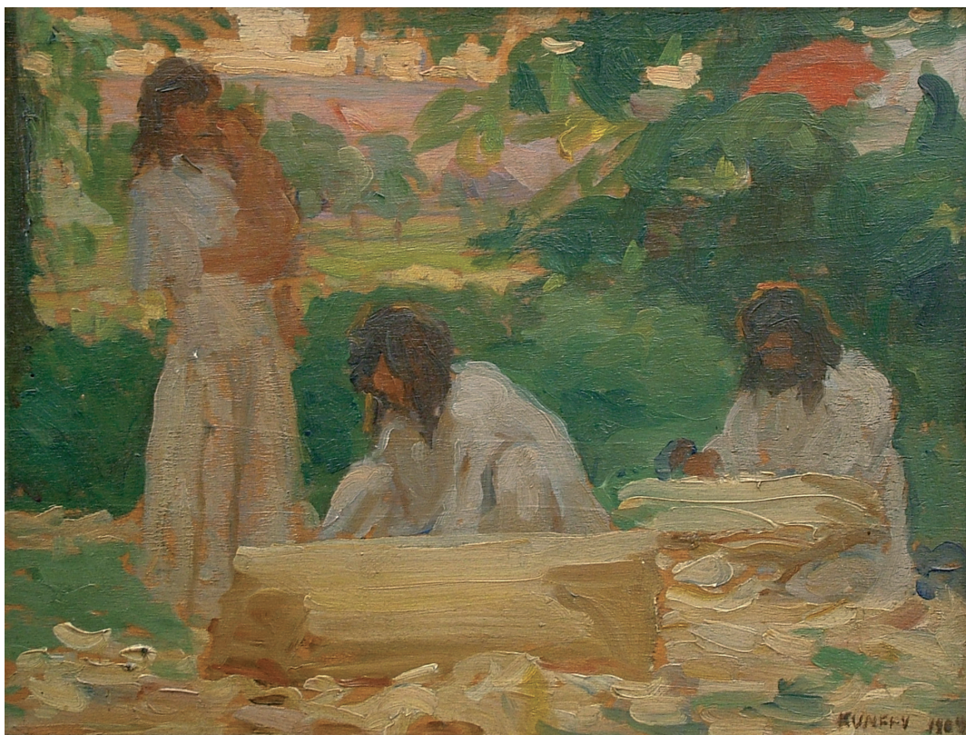
3 ábra. Kunffy Lajos: Teknővájó cigányok (Cigány család), 1911. karton, olaj, 78x70 cm, Rippl-Rónai Múzeum, ltsz.: 64.22.