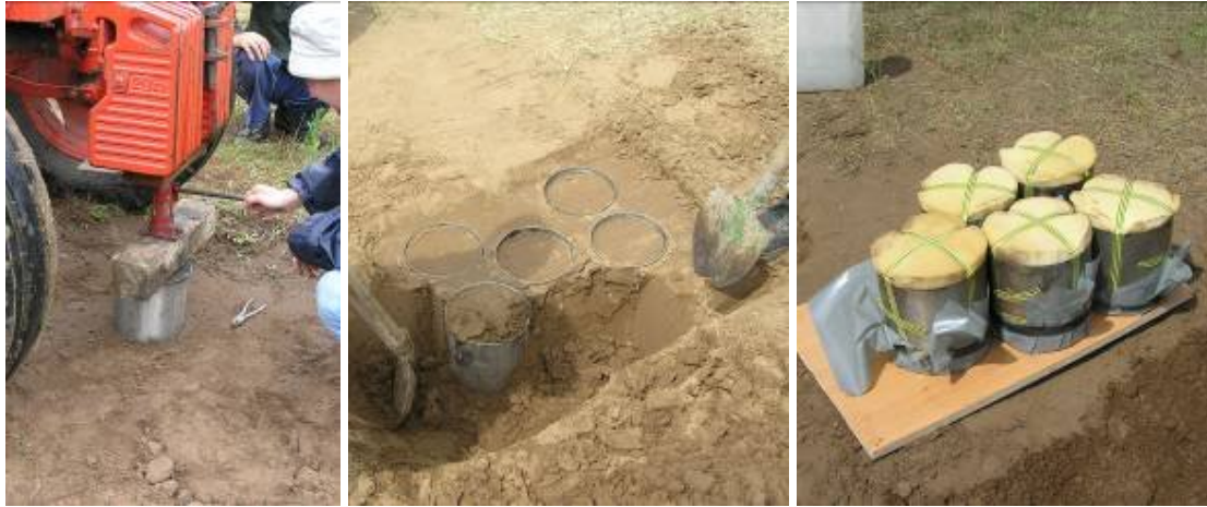
3. ábra: A mintavételezés főbb lépései.

Mintavétel: A nagypatronokat (rozsdamentes acéllemezből hajlítva, falvastagság: 2 mm, magasság és átmérő: 20 cm) a talajba nyomás előtt, belülről szilikon zsírral, vékony rétegben kikenjük. A patronok talajba nyomásához kapható Eijkelkamp gyártmányú 'híd', amelynek azonban két hátránya van: 1) nagyon drága, 2) a hidat a talajba rögzítő menetes száruk nagyobb talajellenállás esetén (pl. száraz talaj) kiszakadnak a talajból. A híd jól kiváltható a mintavétel helyének megközelítéséhez használt járművel (pl. terepjáró). Ennek segítségével a patronokat hidraulikus emelővel préseljük a talajba úgy, hogy a 20 cm magas hengerek 19 cm magasságig teljenek meg talajjal (3. ábra). A hengereket ezután körbeássuk és ásóval alájuk nyúlva óvatosan kifordítjuk őket a talajból. A hengerek alsó peremén túlnyúló talajdarabot hosszúpengéjű késsel vagy fűrészlappal lefaragjuk és a henger aljára, vastag gumival erős fólia darabot helyezünk. A henger tetejét szivacskoronggal zárjuk le.