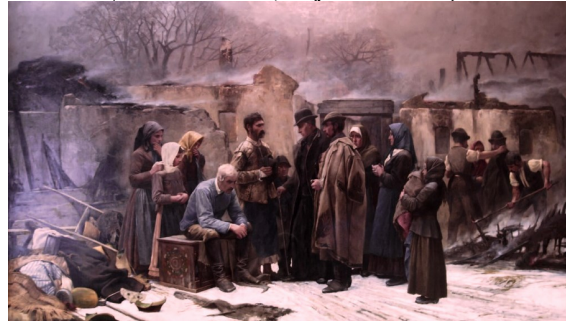
Kárvallottak, (FESZTY - vászon, olaj - 1885-1886).

Forrás ! Digitalizált másolat a szerző tulajdonában.