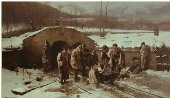
Bányaszerencsétlenség (FESZTY - vászon, olaj - 1885).

Forrás ! Digitalizált másolat a szerző tulajdonában.