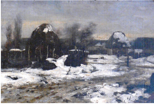
Kárvallottak, vázlat (FESZTY - vászon, olaj - 1882).