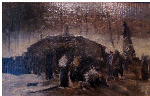
Bányaszerencsétlenség, első vázlat (FESZTY - vászon, olaj - 1884).