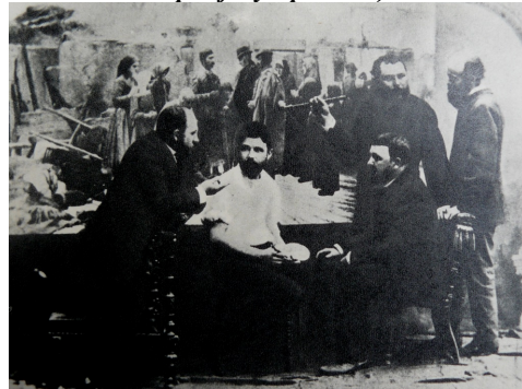
Kárvallottak, (FESZTY - vászon, olajfestmény háttérrel készített csoportfénykép - 1885).