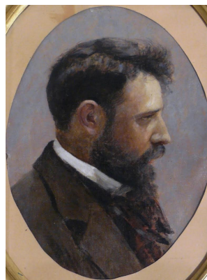
FESZTY Árpád (vászon, olaj - 1896).