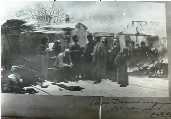
Kárvallottak, (FESZTY - vászon, olajfestményről készült fénykép - 1885 a festő dedikációjával).