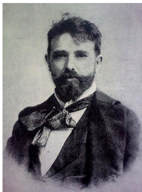
FESZTY Árpád (fénykép 1883).