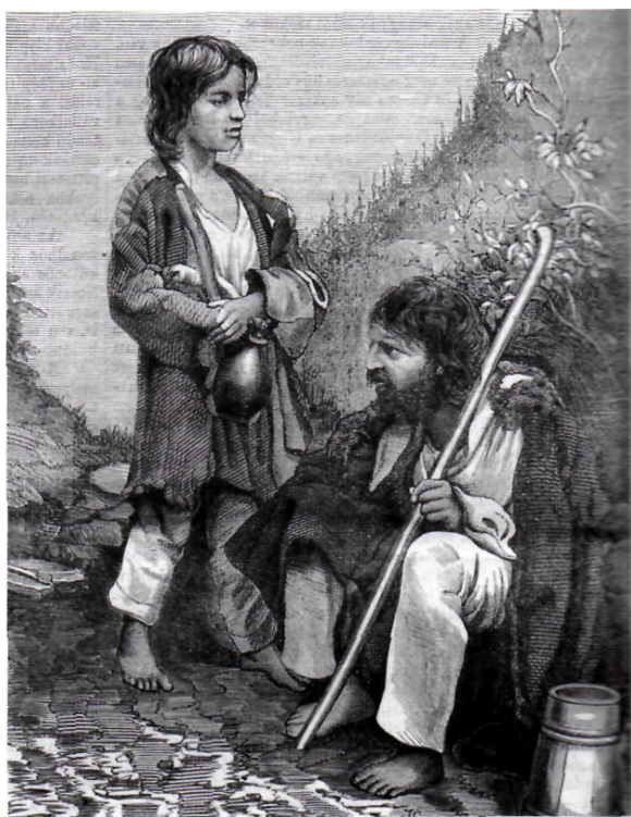
Aranymosó cigányok. Vasárnapi Újság, 1870, 17. oldal (forrás: Bencsik Gábor: Cigányokról. Magyar Mercurius, Budapest, 2008;146)

teknővájó telepeken élő piackereső kézművesekként, részben a falvakban élő napszámosokként. A falvakban napszámos munkából élő, többnyire már katolikus vallású beások paraszti módon („ more rusticano ”) öltözködtek és gyermekeik nevelésében is hasonultak. A kézműves beások identitásának, csoportkarakterének meghatározó vonása a román jelleg. A románok módjára („ more valachico ”) öltözködtek és görögkeleti vallásúak.