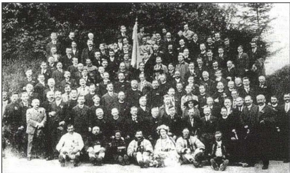
A központi Orosz (Ruszin) Nemzeti Tanács, 1919

Gömör, Borsod, Ung, Bereg és Máramaros – a Csehszlovák Köztársasághoz való csatolását azzal a feltétellel, hogy a csehszlovák állam autonómiát biztosít a többségi lakosságnak, azaz a ruszinoknak. A scrantoni döntés ről értesítették Woodrow Wilson, az Egyesült Államok elnökét is.