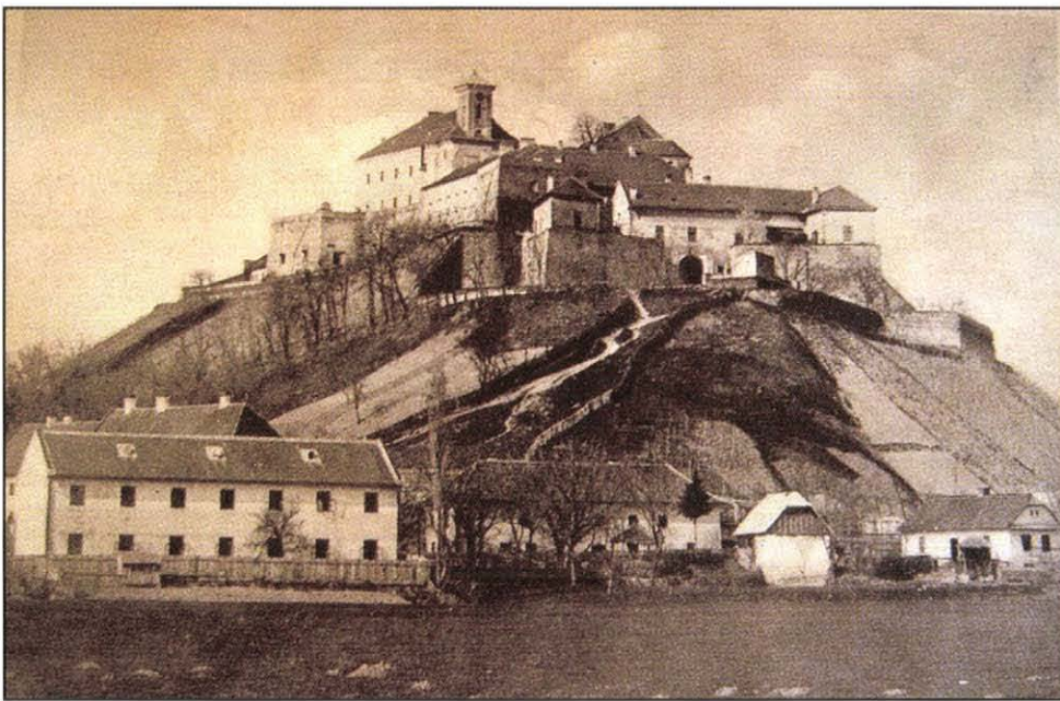
„Zrínyi Ilona munkácsi vára. A csehek kaszárnyává alakították át.” Képes hír az Érdekes Újságban, 1920

Ebben a helyzetben írták alá 1919. szeptember 10-én a saint-germain-i szerződést, melynek értelmében a régió, azaz Kárpátalja (Ung, Bereg, Ugocsa és Máramaros vármegyék nagyobb része) Podkarpatská Rus néven (a magyar nyelvhasználatban egyszerűsítve: Ruszinszkó) a Csehszlovák Köztársaság fennhatósága alá került – a népösszeírás szerint valamivel több mint 600 ezer lakossal. Ebből 370 ezren ruszinnak (orosznak, ukránnak), 102 ezren magyarnak, 80 ezren zsidónak vallották magukat; a többi nemzetiség: a román, a cseh, a szlovák, a német, ill. a roma ennél jóval kisebb számú volt.