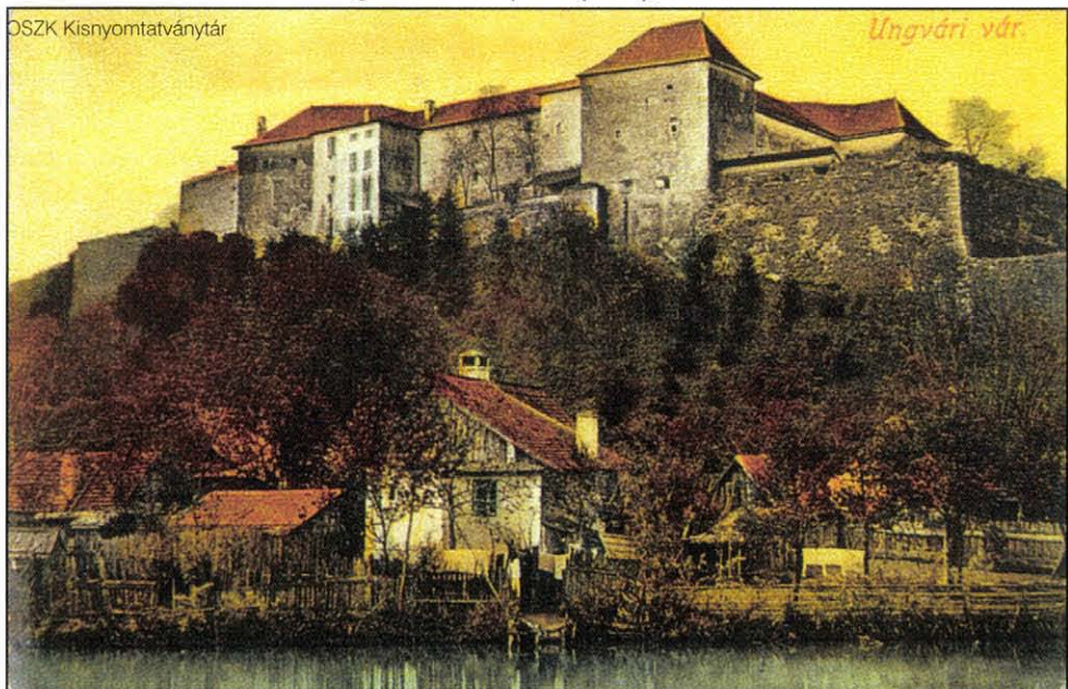
Az ungvári vár látképe. Képeslap, 1910 körül

Ezt követően, 1919. május 8-án a csehszlovák megszállás alatt levő Ungváron az eperjesi, az ungvári és a huszti ruszin tanácsok közös gyűlést tartottak, amelyen megalakították a Központi Orosz (Ruszin) Nemzeti Tanácsot, amely kimondta a Csehszlovákiához való „önkéntes” csatlakozást. Augusztusban a csehszlovák kormány elkezdte a megszállás kezdetétől fennálló katonai közigazgatás mellett a polgári igazgatás megszervezését.