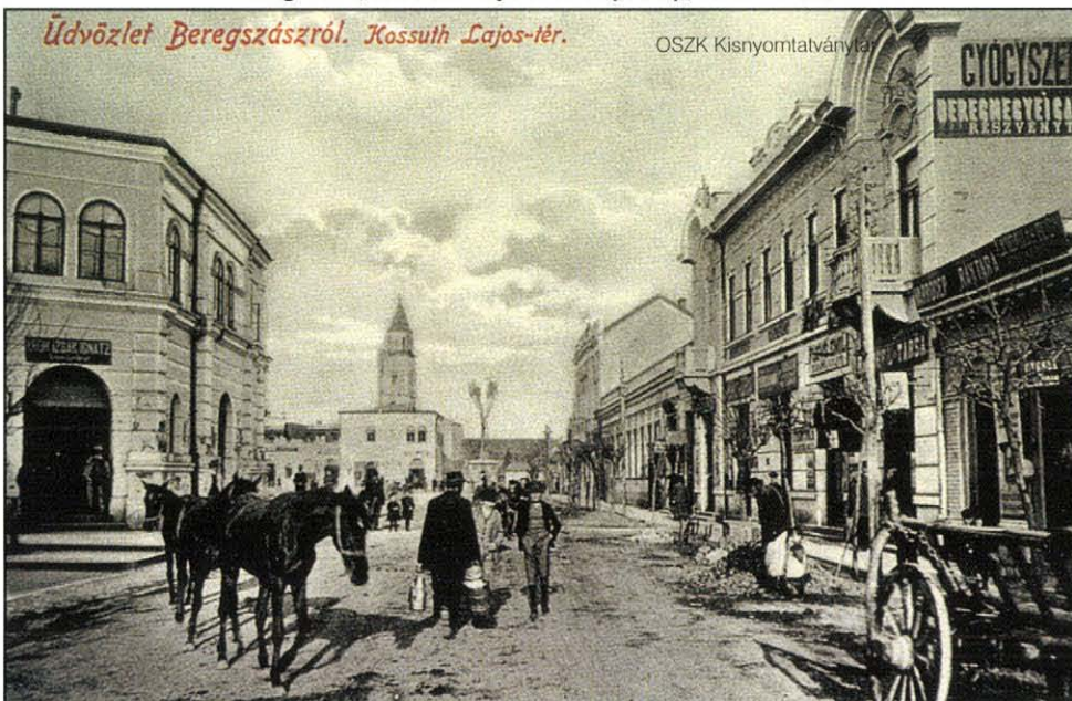
Üdvözlét Beregszászról. Kossuth Lajos-tér.