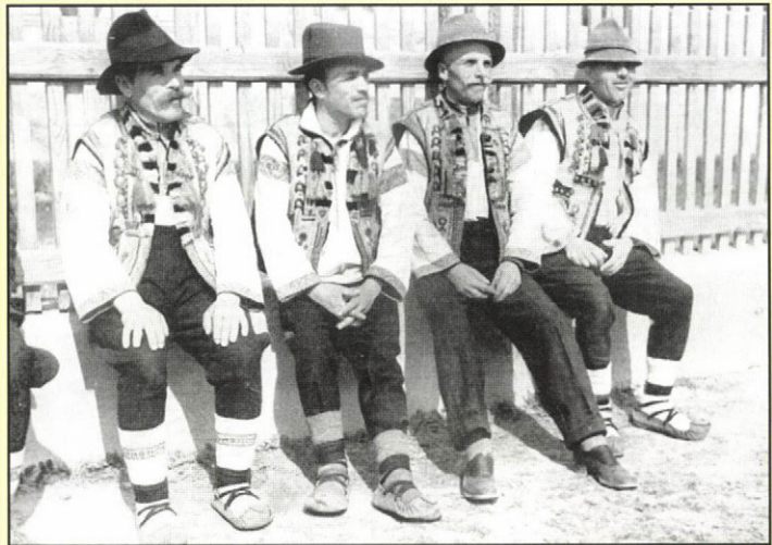
Rutén parasztok népviseletben, 1920-as évek

1944 őszén Kárpátalja és az itt élő ruszinok szovjet fennhatóság alá kerültek, és a Szovjetunióban a ruszin mint külön nemzetiség nem létezett, így ukránoknak nyilvánították őket. Az 1991 óta független Ukrajna sem ismeri el hivatalosan a ruszin nemzetiséget, szemben más országokkal, pl. a szomszédos Szlovákiával vagy Magyarországgal. Pontos számuk így megállapíthatatlan. A görögkeleti (pravoszláv) és a görög katolikus vallást gyakorolják. A kárpátaljai ruszinokat földrajzi elhelyezkedés szerint két fő csoportra oszthatjuk: a síkfüldön