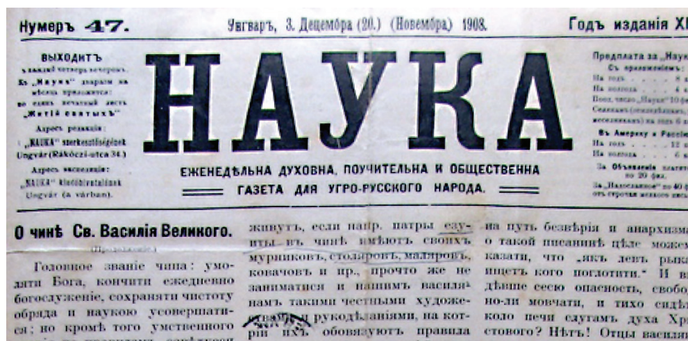
2. kép A Nauka egyik 1908-as címlapja