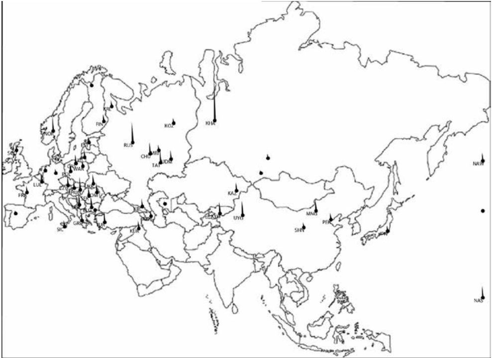
5a ábra. A 4. számú zenei-genetikai szövetség súlyai Eurázsia térképén. Az oszlopok a népek átlagos súlyát mutatják a szövetséghez tartozó zenei és genetikai típusok súlyvektoraiban.