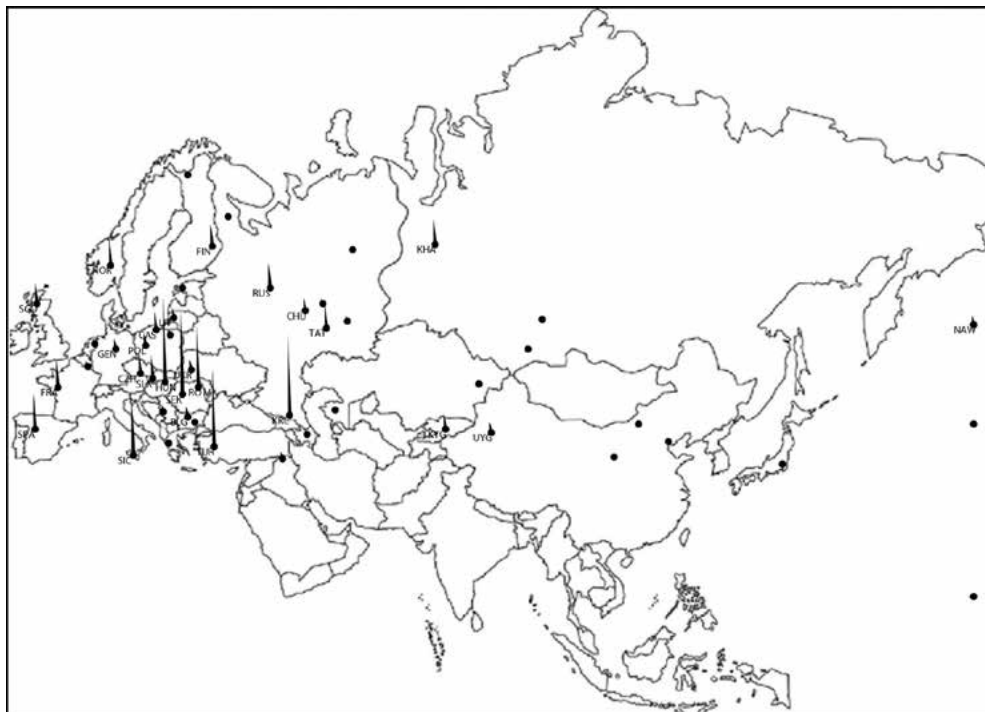
4a. ábra. A 3. számú zenei-genetikai szövetség súlyai Eurázsia térképén. Az oszlopok a népek átlagos súlyát mutatják a szövetséghez tartozó zenei és genetikai típusok súlyvektoraiban.