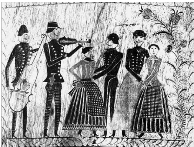
Népi muzsikálás és néptánc ábrázolása spanyolozott mángorlón (1868, Hövej)