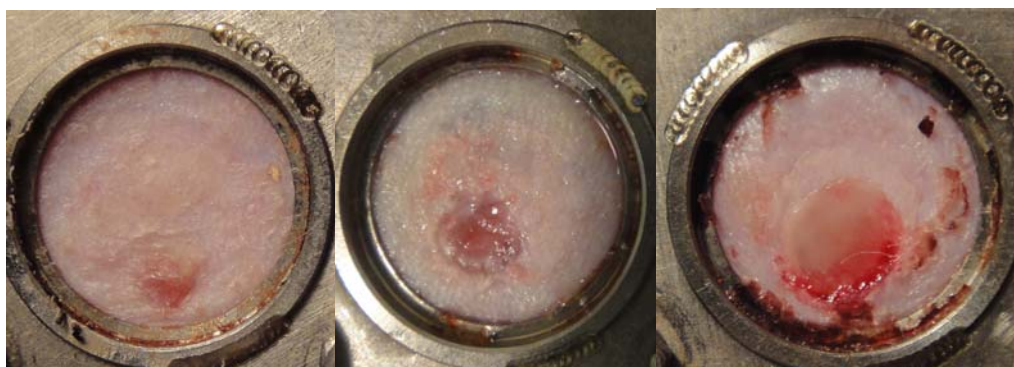
14. napon végzett leolvasás (balról az 1. kép: PBS, 2. kép: mF4-31C1, 3. kép: DC101 kezelés)

2. A kézi nyirokdrenázs kezelés alkalmazása 10 nap hosszúságú terápia részeként már szignifikánsan növelte ( p=0.027 ) a vénás eredetű krónikus sebek gyógyulási sebességét a kontroll csoporthoz képest, ami arra utal, hogy javasolt kiegészítő kezelésként alkalmazni vénás lábszárfekélyek gyógyításában, hiszen új támadásponttal rendelkezik, valamint gazdaságosabbá teszi a fekélykezelést (Tuczai és mtsai, 2010).