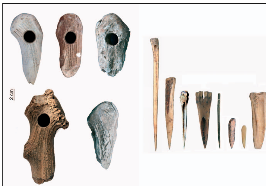
2. ábra: Nyelezett agancsszerszámok és csonteszközök Kaposújlak-Várdombról

A csontleletek többsége ételhulladék, ám egy tehénkoponya, amelyet emberi maradványok közelében találtak, áldozati állatra utalhat. Ezen kívül egy objektumba marha-, ló- és vaddisznófejeket, valamint egy kutyát helyeztek kevés ételmaradvánnyal (?) együtt, ám az egyéb régészeti lelet szempontjából ez a gödör is a többihez hasonló hulladékgyűjtőnek tűnik. A fenti kérdésben a régészeti feldolgozás előrehaladottabb állapotában számítunk megbízhatóbb információkra.