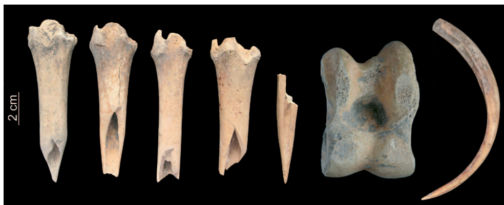
3. ábra: Megmunkált csontok és vaddisznó agyar Paks-Gyapáról

Ettől északi és keleti irányba terül el a „Pannón erdős-sztyeppi terület”; ezen a területen található a Makó kultúrához sorolt Paks-Gyapa, Balatonkenese-Kapuvári u. 7. és Üllő lelőhelyek. A sztyeppi környezet a vizsgált állatcsont-együttesekben is tükröződik: