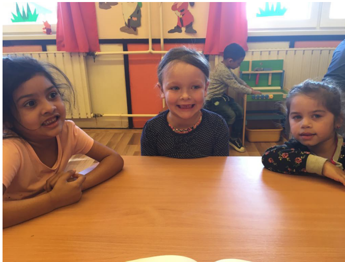
8. kép: Utánozzuk a mentőautó szirénáját! Arc- és ajakgyakorlat (Saját készítésű képek)

A hangadással nehezített arc- és ajakgyakorlatok közül négy-öt éveseknek ajánlott az Utánozzuk a mentőautó szirénáját! játék (8. kép). Lényege az u-i hangok ejtése lassan, majd gyorsabban az ajkak csücsörítésével és széthúzásával, zárt fogsorral. Nagyon tetszett a gyerekeknek ez a feladat, ügyesen oldották meg, tisztán ejtették a magánhangzókat.