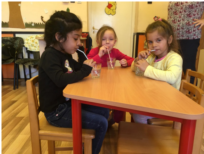
1.a kép: Szívógyakorlat vízzel

Ezek a játékok elősegítik a szájon át való ki- és belégzést, erősítik a lágy szájpadot és az ajkak izomzatát. Rövid ideig végeztetjük. A négy-öt éveseknek ajánlott formája például, hogy a gyerekek szívószállal előbb vizet (1.a kép), majd gyümölcsjoghurtot szívjanak fel (1.b kép) (Dankó, 2016, 209). Ahogyan a képek is mutatják, a lányok a vizet minden megerőltetés nélkül szívták a szívószállal, majd amikor a sűrűbb joghurtot kellett szívniuk, az már nehezebben ment. Látszik az arcuk „behorpadásán”, hogy erősen szívják, mert nehezen akar feljönni a szűk keresztmetszetű, hosszú szívószálon keresztül. Ők is mondták, hogy nem bírják, nehéz.