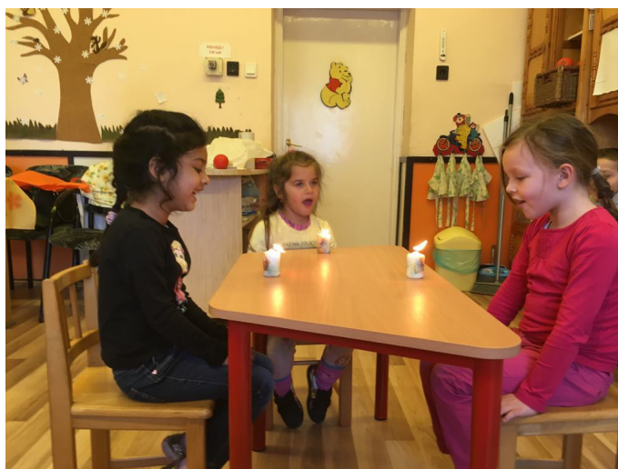
3. kép: Gyertya fújása f, p, t hangok szakaszos hangoztatásával

A lányok elmondása szerint nehéz volt ez a feladat, mert úgy akarták elfújni a lángot, mint a szülinapi tortájukon. Akármelyik hangot képeztük együtt, egyik segítségével sem sikerült elfújniuk a gyertyalángot, ennek ellenére nagyon élvezték ezt a játékot is. Heti rendszerességgel gyakoroltuk, de azt tapasztaltam, hogy a hathetes vizsgálati-fejlesztési idő nem elég a lemaradások behozatalára, hiszen kiderült, hogy a háromévesek szintjén végzik a feladatokat. Történtek azonban pozitív változások is a lányok hangképzésében, aminek köszönhetően az ötödik héten egyszer vagy akár többször is sikerült eloltaniuk a lángot.