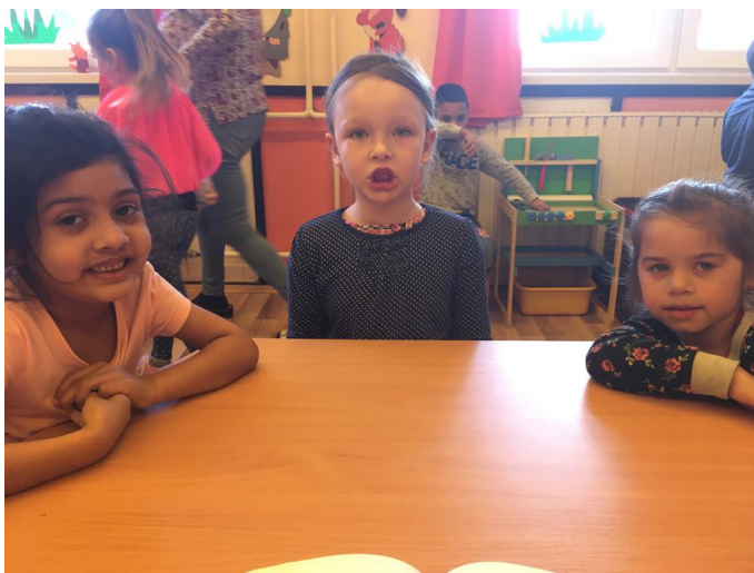
7. kép: Hogyan berreg a motor? Hangadással összekötött légzőgyakorlat

A három kislány egyike sem tudja tisztán képezni a r hangot, ezért a logopédus, az óvodapedagógusok és a család fejlesztő munkájának erre is ki kell terjednie. Az eddigi fejlesztés azonban még nem hozta meg a várt eredményt.