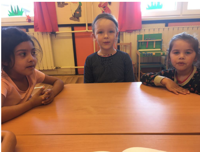
6. kép: Hogyan fúj a cica, ha kutyát lát? Hangadással összekötött légzőgyakorlat

A Hogyan berreg a motor? játékban egyetlen pergőhangunk, a r hang képzése volt a feladat (7. kép). A magyar gyerekek a hangok elsajátítása során a mássalhangzók közül a r hangot később hangoztatják. Sokaknak problémát okoz a pergetése, és inkább helyettesítik egy másik hanggal, vagy nem tökéletesen képzik.