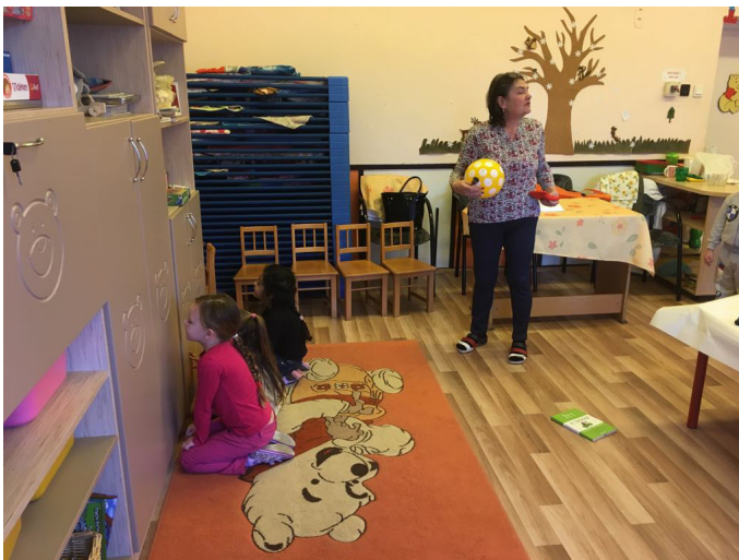
4. kép: Mi pottyant le? Találd ki! Hallásfejlesztő játék

Az idő múlásával úgy nehezítettük a játékot, hogy bővítettük a leejtett tárgyak körét. Nem okozott nehézséget nekik ezek hangjának a felismerése sem. A csoport többi tagja is szívesen játszott velük ezt a játékot.