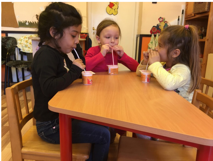
1.b kép: Szívógyakorlat joghurttal