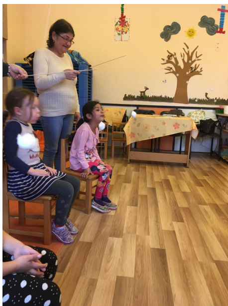
2. kép: Fúvógyakorlat hurkapálcára erősített vattával

A fúvógyakorlat lényege az volt, hogy az általam hurkapálcára zsineggel rögzített vattapamacsot minél távolabbra fújják a gyerekek (2. kép). Ezt már háromévesekkel is lehet végeztetni azzal a megszorítással, hogy nekik kisebb távolságból kell elfújni a vattát. A négy-öt évesek esetében nehezítjük a gyakorlatot (fokozatosság) a távolság (a hurkapálca hossza) növelésével. Ennek a kivitelezéséhez több levegőre és intenzívebb ajakizommozgásra van szükség, tehát a vegyes mélylégzésben részt vevő izmokat és az ajakizmot eredményesen erősíti.