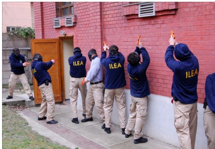
Az ún.: utcai túlélés intézkedéstaktikai oktatás

Az idegen nyelvű kurzusokként fennmaradó két helyet magyar tisztek töltik be, mert az USA Kormánya ezzel is elismerését fejezi ki a magyar államnak, mint vendéglátó országnak, az ILEA Program létrehozásában nyújtott támogatásáért (a részvétel feltétele, hogy a magyar tisztek tárgyalási szinten beszéljék az angolt, vagy az adott kurzuson résztvevő három ország nyelvének egyikét).