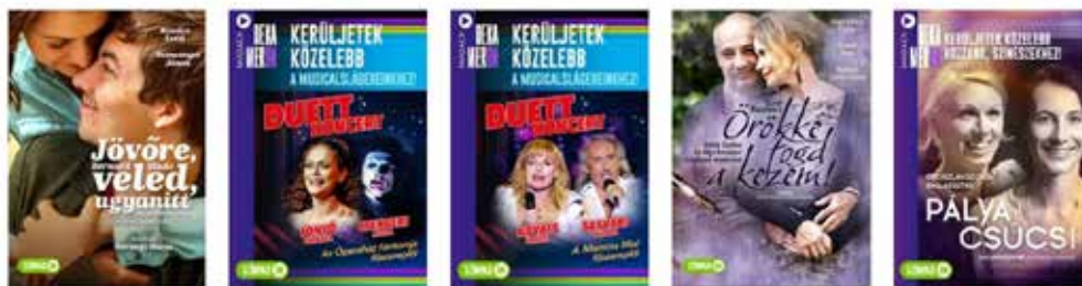
2. ábra: A Madách Színház online repertoárjából Out of the repertoire of Madách Theatre