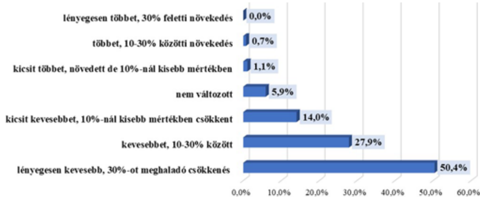
3. diagram: A barátokkal történő személyes találkozás változása Changing of meeting friends in the flesh

Kicsit szomorú voltam, mert a barátaimmal szok-