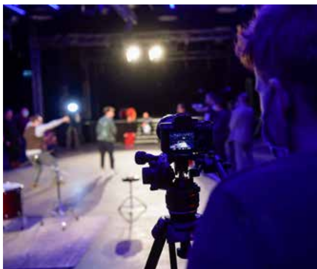
1. ábra: Kamerás élő közvetítés a színpadról Live broadcasting from the stage

ház (SzínházTV, 2021). Hasonlóan működik az eSzínház (2021) oldal is, melynek kínálatában megtalálhatóak élő, felvételtől sugárzott és bármikor megtekinthető produkciónak és koncertek is. A Madách Színház ezzel szemben saját platformon próbál meg online előadásokat tartani SzínpadOn fantázianévvel. A kínálatban nemcsak hagyományos előadások, hanem duett koncertek és különleges tudakozó színesekkel zenés/beszélgetés is található (Madách Színház, 2020).