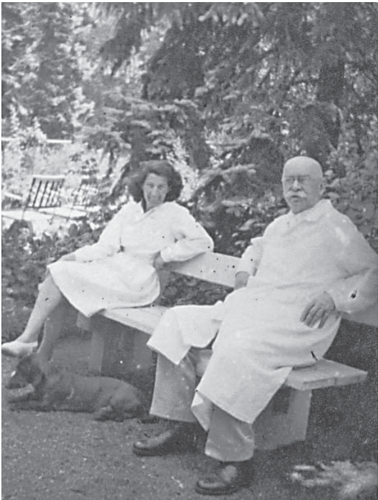
8. kép Reuter professzor és kolléganője az idegklinika kertjében 1943-ban