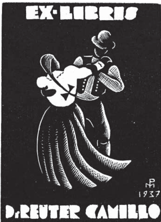
12. kép Patay Mihály Reuter Camillo részére tervezett ex librise (1937)