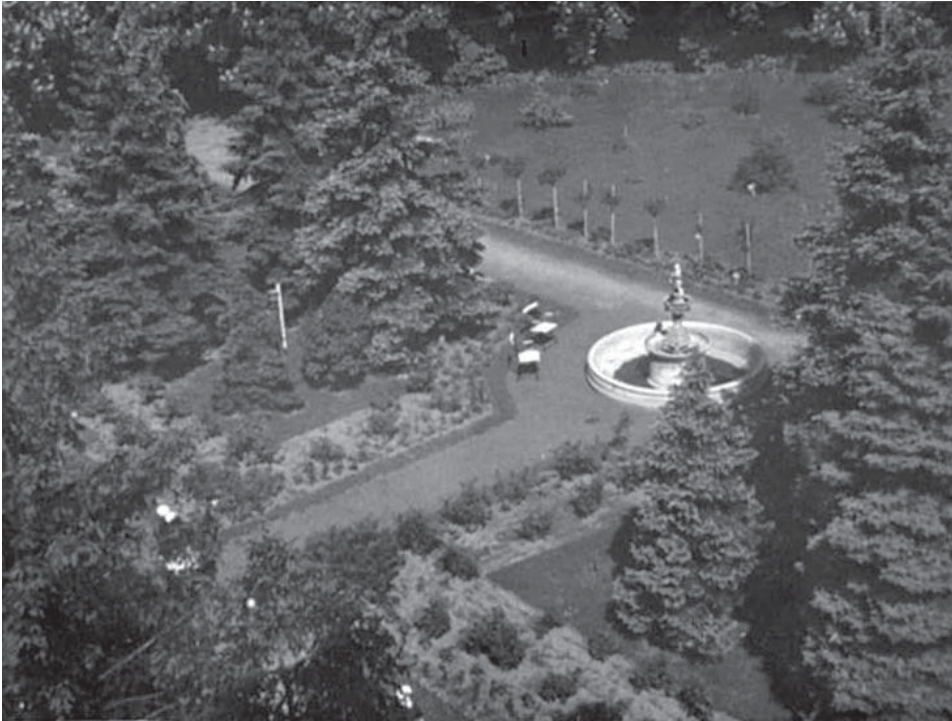
7. kép A klinika kertje a szökőkúttal az 1930-as években