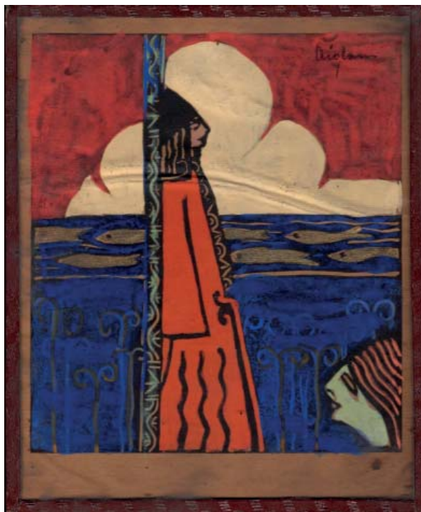
10. kép Sassy Attila Turáni álom című linóleummetszete (é.n.)