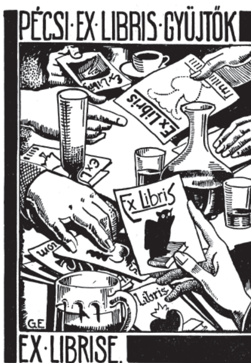
13. kép Gebauer Ernő a pécsi ex libris gyűjtők részére tervezett ex librise

Az 1., 2., 3., 4., 5., 6., 7., 8., 10., 11., 12. kép a Pécsi Egyetemi Könyvtár és Tudásközpont Történeti Gyűjtemények Osztálya Reuter Gyűjteményéből, a 9. kép a Szépművészeti Múzeum Grafikai Osztályának gyűjteményéből származik.