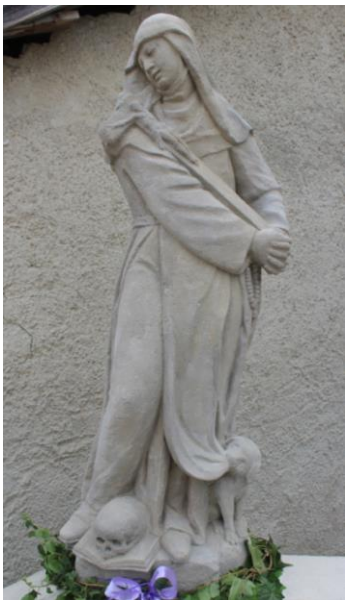
Cortonai Szent Margit szobra. Szentek Lépcsője (Sopronbátfalva) 73