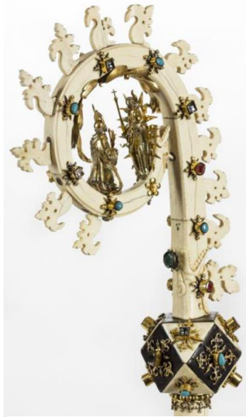
6. Szent Bernát pásztorbotja, Zwettl, Stift Zwettl

A felső-ausztriai Zwettl ciszterci kolostorában őrzött pásztorbot (6. kép 114 ). Helyi hagyomány szerint a pásztorbotot a rendalapító Clairvaux-i Szent Bernát adományozta, mikor 1140-ben Magyarországra menet meglátogatta a kolostort, melynek leltárában azonban először csak 1451-ben szerepel. 1626-ban a pásztorbot fejét drágakő utánzatokkal és a kurvatura belsejében aranyozott ezüst levelekkel és virágokkal díszítették, 1646-ban pedig a Madonna és Szent Bernát ábrázolását illesztették a közepébe aranyozott ezüstből. Egy korábbi ábrázolás léte a kurvatura belső ívén található lyukak, a rögzítés nyomai utalnak. A pásztorbot 17. századi átalakításakor távolíthatták el a ráfestett feliratot – a levelek és a sárkányfej festésével együtt –, ezért nincs fogódzónk arra, hogy eredetileg a kurvatura belsejében milyen figura vagy jelenet állhatott. Az egykori színezésről csak fekete, vörös és arany festéknyomok árulkodnak.