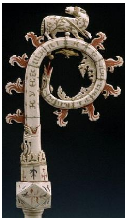
4. Pásztorbot, Perugia, Museo Nazionale dell'Umbria (lelt. sz. 763)