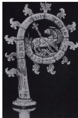
5. Pásztorbot, Salzburg, Stift Nonnberg