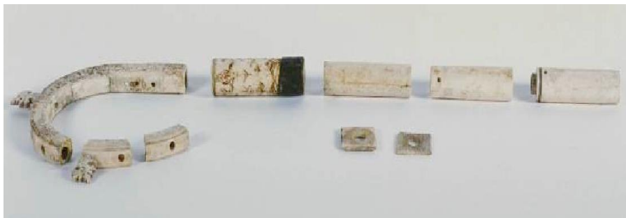
2. Magyar Boldog Gergely pásztorbotja, Rimini, Tesoro della Cattedrale

Az olasz katolikus egyház kulturális javainak adatbázisában (BeWeb2020) a pásztorbotról 2009-ben készült egy rekord – hibákkal és újabb téves névalakkal. Címe: „Itália, 14. század, B. Ungano [!] pásztorbotjának töredékei”. 84 Közli a pásztorbot maradványainak fotóját (2. kép), méretét (18x16 cm – nem világos, pontosan mire vonatkozik) és rövid leírását: „faragott, aranyozott, festett, elefántcsont pásztorbot, mely kilenc darab, beato Gregorio Ungano [!] csontjai között talált töredékből áll (a henger alakú részek átmérője 2,2 cm), kurzív gótikus betűs felirattal a rúdján [! – helyesen: a kurvatúráján.]”