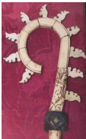
3. Szent Izidor pásztorbotja, Bologna, Museo della Basilica di Santo Stefano

készült. Mivel belsejében komplex plasztikai ábrázolásnak és erre vonatkozó feliratnak még nincs nyoma, Silvia Giorgi, aki a legalaposabb vizsgálatnak vetette alá, a botot korainak tartja, keletkezését az 1250–1260 körüli időszakra teszi. 103