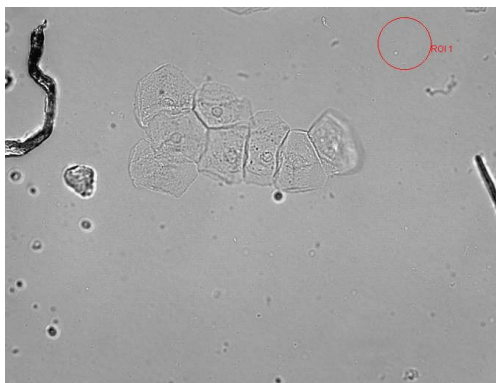
Fig. 1. Humán nyelőcső biopsziából enzimatis módszerrel izolált epitél sejtek. Az izolálást követően a sejtek egy sejtrétegű 10-15 sejtől álló csoportokban helyezkedtek el.

1.a. Nyelőcső epitél sejtek izolálása biopsziából enzimatis módszerrel. A sejtizolálási technika során a biopsziás mintákat (4-5 db) jéghideg HBSS oldatban mostuk kétszer. Ezt követően kollagenáz A-t (1000 U/mL) illetve elastase-t (50 U/mL) tartalmazó MCDB153 komplett médiumban inkubáltuk 1.5-2 órán keresztül 37°C-os rázó vízfürdőben. Az enzimatis emésztést követően az epitél sejteket fénymikroszkóp alatt, mikrodisszekciós technikával izoláltuk (fig. 1) és az így kinyert sejteket közvetlen felhasználtuk a kísérleteinkhez.