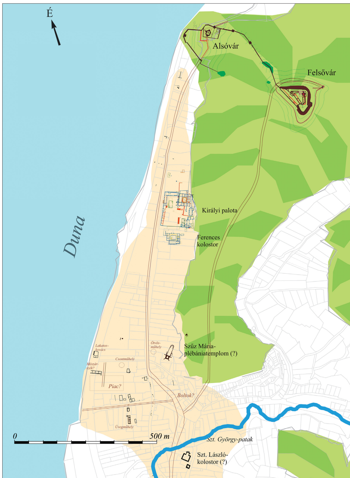
2. ábra. Visegrád város a 15. században. Rajz: MÉSZÁROS 2009a, 41. ábra nyomán, módosítva Fig. 2. Visegrád town in the 15th century. Drawing: after MÉSZÁROS 2009a, Fig. 41, modified