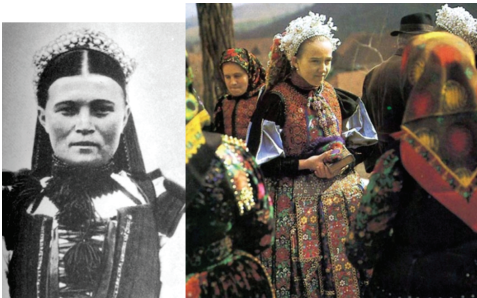
Fig. 2. Fete cu diademe decorate cu mărgelile: a. Vulcani, jud. Cluj, 1894 ( http://mek.oszk.hu/02100/02115/html/img/4 ); b. Viștea, jud. Cluj, anii '70 ai secolului XX ( http://mek.oszk.hu/02100/02115/html/img/4-160r.jpg ).

opinia noastră, o analiză monografică a acestei categorii de artefacte din Bazinul Transilvaniei ne-ar oferi mai multe și mai detaliate informații socio-antropologice referitoare la realitățile epocii medievale.