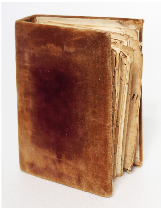
1. ábra Élthes Ilona és Mórik Károly albummá kötött jegyességi levelei