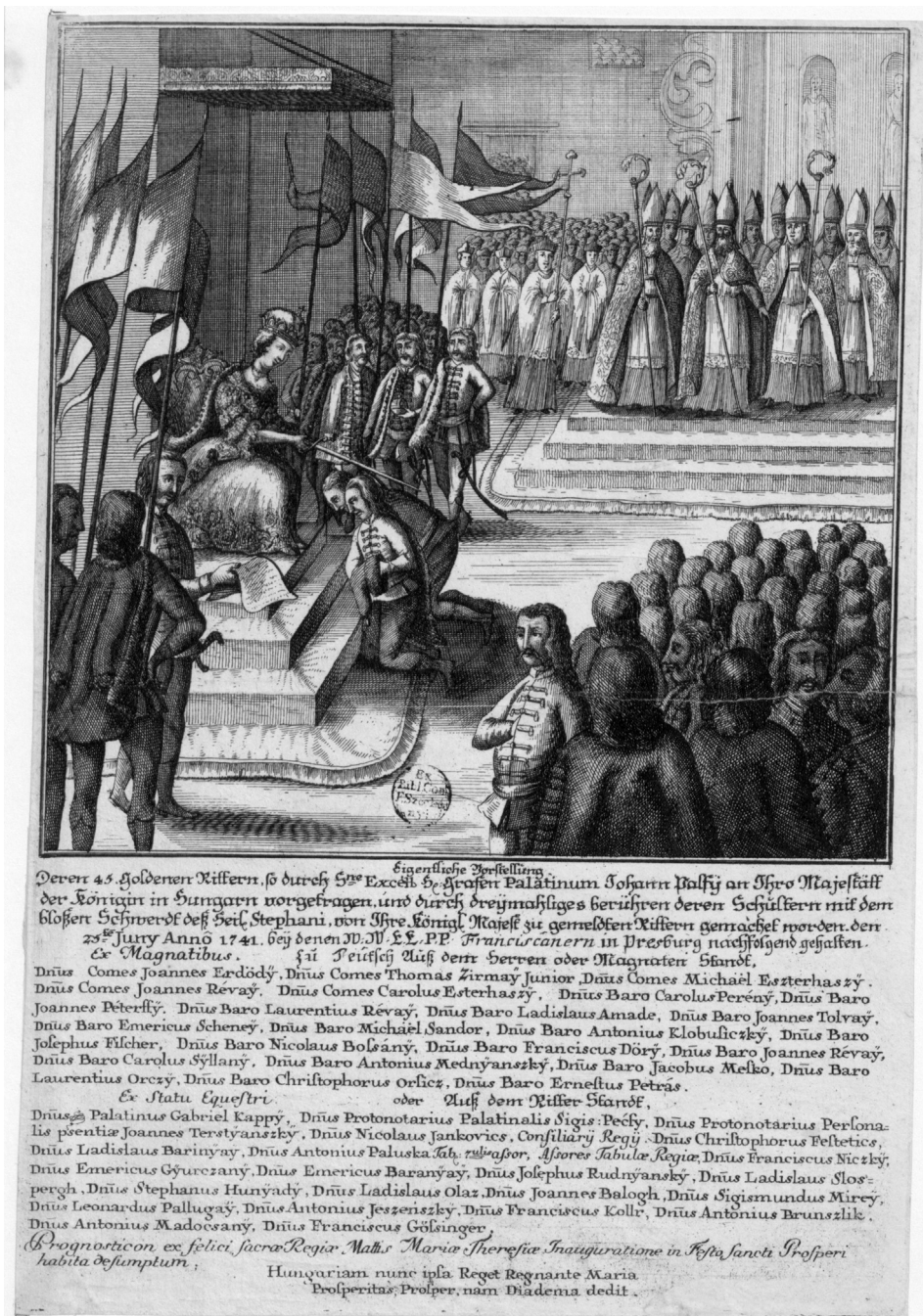
Mária Terézia aransarkantyús lovagokat avat