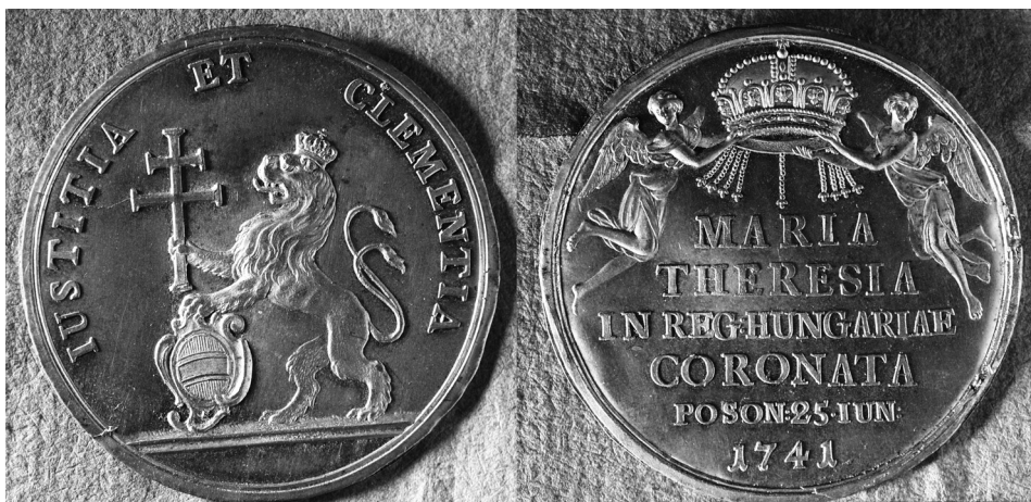
Mária Terézia felajánlási érméjének tervezete (MNL OL A 39, Acta generalia, 1790 No. 5903.)

aranyozott, illetve az ezüstözött kancsóban is bor volt, amelyeket a mise-felajánláshoz vittek. 588 A király az érsek felajánlási imája után evett mindkét kenyérből és ivott mindkét kancsóból, amelyeket a boroszlói püspök nyújtott neki át. Ezeket a templomba vonulási menetben négy főúr vitte. 589