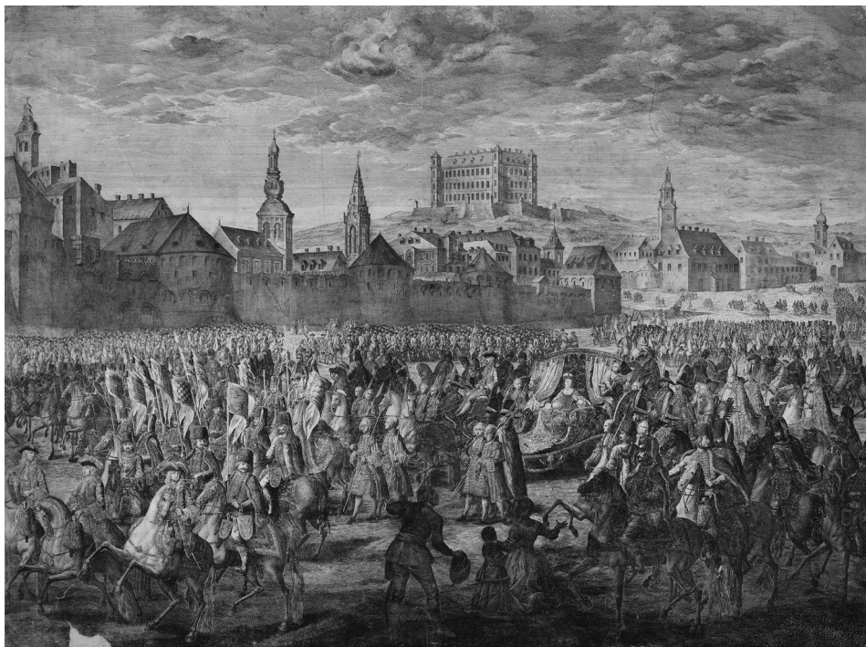
Mária Terézia a ferencesek templomából induló koronázási menete a pozsonyi Vásártéren (MNM TK Grafikai Gyűjtemény, 2105 ltsz.)

felemelve, másik kezében a feszületet tartva az esztergomi érsek előolvasásával letette az esküt a királyság szabadságának megtartására. A jelenlevők hajadonfőtt álltak, és az eskü után kiáltották: Vivat domina et rex Noster! , illetve másodjára sütötték el az ágyúkat. 669 Egy másik forrás írója a rendtartásban egyes szám második személyben jegyezte fel: Vive domina Rex Noster! , de az esemény leírásában már ő is a fenti változatot rögzítette. 670