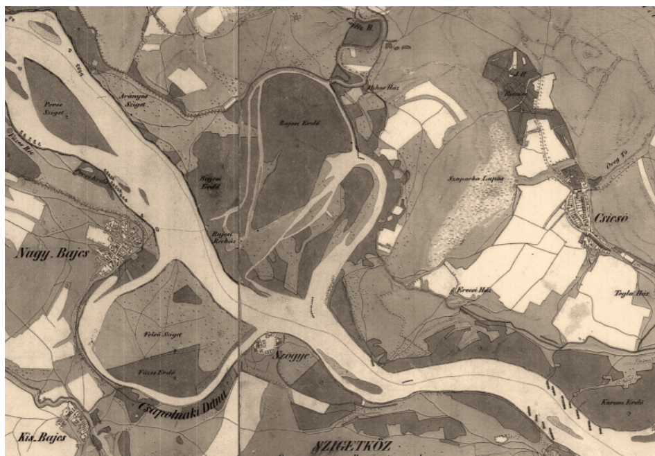
4. ábra A csicsói mellékág a II. katonai felmérés térképén (1820-as évek). Figyeljük meg a Duna főágának és ágrendszerének jelentős változását a 3. ábrához képest.

Figure 4. The Csicsó anabranch on the second military survey map (from the 1820s). Note the significant changes of the main stream and the anabranch system of the Danube, compared to Fig. 3.