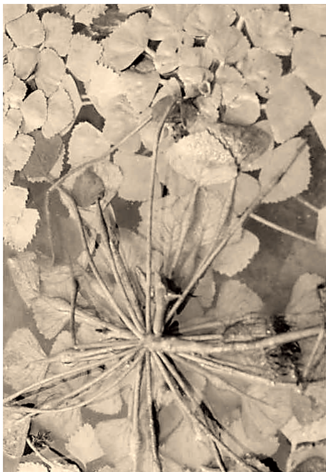
7. ábra Sulyom – Trapa natans Figure 7. Water chestnut - Trapa natans

A nádas és zombéksásos gyűrűje fokozatosan megy át a holtágat övező ligeterdőbe. A vízhez közeli, magas vízállás idején gyakrabban elöntött szinteken fehérfűzűből és számos fűzfajból álló puhafa-ligeterdőt találunk (1. élőhely-típus). Ezeket két társulás jellemzi: a bokorfüzesek és a fűz-nyár ligeterdők. A bokorfüzesek a vízparthoz közelebb eső fás társulások, az iszapnövényzetet és a medergyom-társulásokat váltják a szukcesszió során (7. élőhely-típus). Viszonylag gyorsan alakulnak át fűzligetekké, helyenként fűz-nyár ligetekké. A puhafaligetek a magasabb térszínen találhatóak, itt a vízelöntés az év folyamán már csak 1–2 hónapig tart. Ezekben a ligeterőkben található füzeket a holtág körül három faj képviseli: legelterjedtebb közülük a fehér fűz ( Salix alba ). A rekettyefűz ( Salix cinerea ) főleg az öreg töltés körül figyelhetjük meg, míg a csigolyafűz ( Salix purpurea ) a holtág délnyugati részén alkot sűrűbb állományt. A nyárfajokat a fekete, a szürke és a fehér nyár képviseli. A fekete nyár ( Populus nigra ) öreg példányai a holtág nyugati részén láthatóak, míg a fehér nyár ( Populus alba ) szinte mindenütt elterjedt.