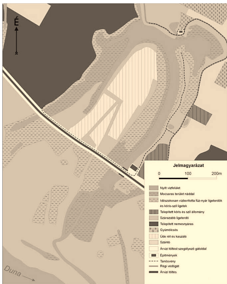
8. ábra A holtág és környék élőhely- és vegetációterképe Figure 8. Habitat- and vegetation map of oxbow lake and its surroundings