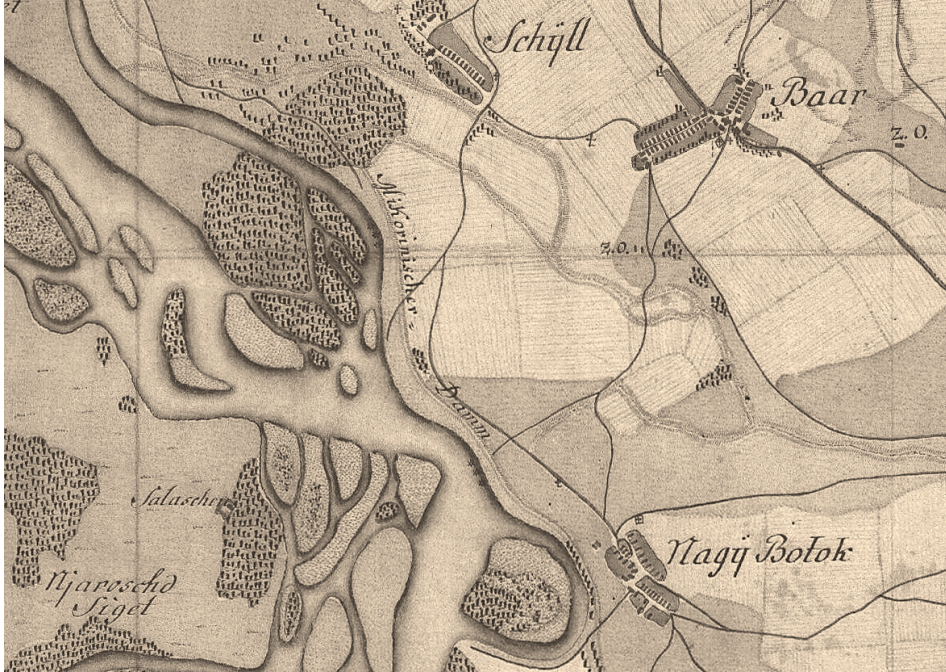
2. ábra A Mikoviný-gát („Mikovinischer Damm”) Nagybodak felett az I. katonai felmérés (1783–86) térképszelvényén.

első állandó települések valószínűleg a 11. században keletkeztek, s a 12. században már meg is jelennek az írásos emlékekben. A holtág közelében fekvő Csicsó községet először 1172-ben Sysou néven, később Chychouként említik (BINDER et al.1981).