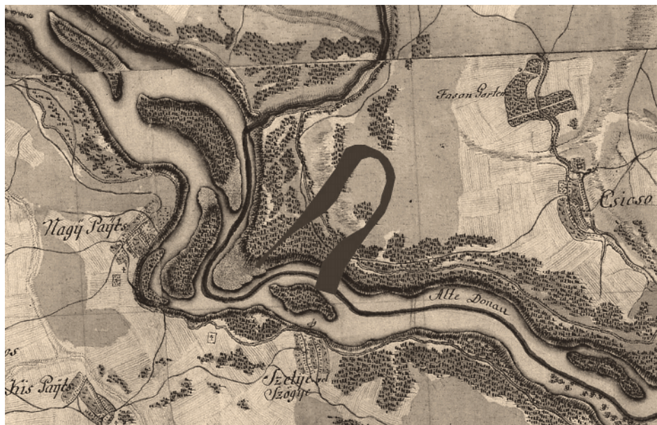
3. ábra A Csicsói-holtág későbbi (II. felméréskori) helyén az I. felmérés térképszelvénye még semmilyen hasonló alakzatot nem mutat: a mellékág tehát 1786 és 1822 között alakult ki.

téka a jobb parton, Nagybajcs és Kisbajcs között szintén a két felmérés között kialakult mellékág (4. ábra). Az újonnan kialakult csicsói mellékág a második felmérés időszakra, az 1820-as évekre már lefűződés-közeli állapotba is került.