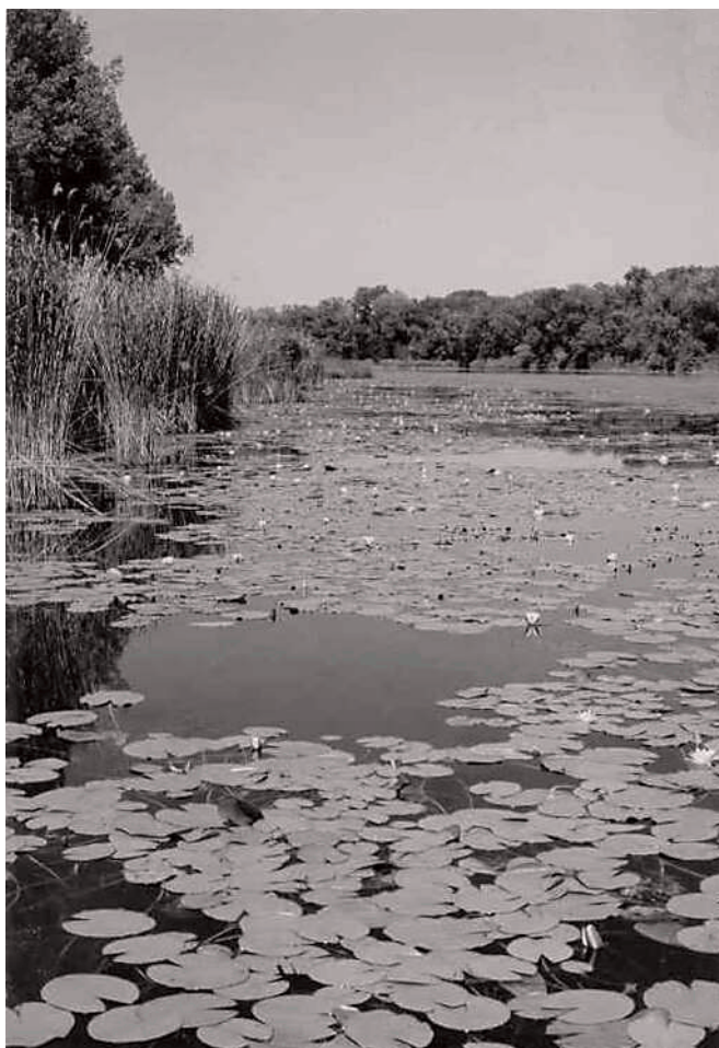
6. ábra Fehér tündérrózsa - Nymphaea alba Figure 6. White water lily - Nymphaea alba

A holtág part menti sávjait a mocsári, jó vízellátottságot igénylő fajok népesítik be (4. élőhely-típus). Ezek az élőhelyek állandóan vagy az év nagy részében vízzel borítottak, talajuk humuszban gazdag öntés. A mocsári gólyahír ( Caltha palustris ) tavasszal tömegesen virágzik a holtág körül. A mélyebb vizekben a közönséges nád ( Phragmites australis ) szinte az egész vízfelszínt szegélyezi, 1–4 m magas kiterjedt nádasokat alkotva. Partvédő, víztisztító szerepe közismert. (A felszakadozott állományok külső gyűrűje zsombékol.) A holtág déli részén nagyon gyakori a széleslevelű gyékény ( Typha latifolia ) és a keskenylevelű gyékény ( Typha angustifolia ). A vizes élőhelyek karakterfajaként a parti sás ( Carex riparia ) is képviselteti magát, ami rendszerint a nádas zónát veszi körül. Gyakori még a zsombéksás ( Carex elata ) és számos egyéb sásfaj is.