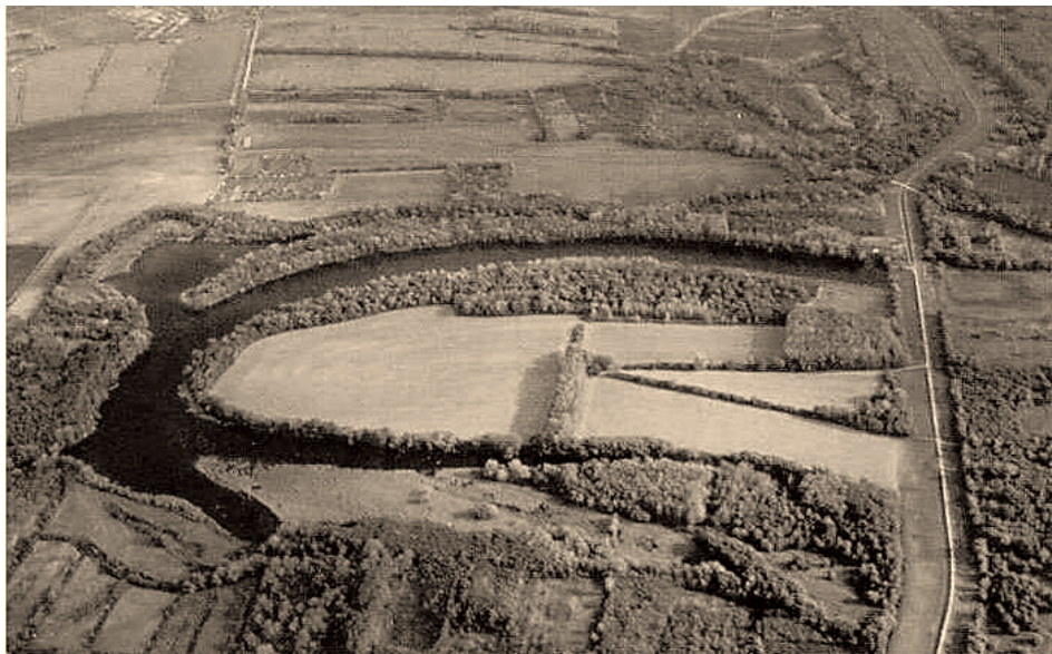
1. ábra A csicsói holtág jellegzetes meander-alakja légifelvételen. A kép jobb oldalán megfigyelhető a holtágat átmetsző, a második világháború után épült dunai árvízvédelmi töltés. Figure 1. The characteristic meander-shape of the Csicsó oxbow lake on an aerial photograph. On the right the new flood control dyke cutting into the lake, built after the WWII, can be seen.

nak nevezett alak típusa felé való átmeneti, úgynevezett vándorló (MIALL 1977) típusú. Ezt a formát a határozottan elkülöníthető, legnagyobb hozamot szállító, kisebb-nagyobb mértékben kanyargó főág, és az arról leszakadó, lényegesen alacsonyabb vízhozamú, kanyargós mellékágakból álló, kiterjedt rendszer jellemzi, és legtöbbször kavicsos hordalékon alakul ki. A főágról leváló, kisebb hozamú mellékágak, mint a Mosoni-Duna, a Kis-Duna és a Vág-Duna, azonos esés mellett az alacsonyabb energiájú folyókra jellemző kanyargós (meanderező) alak típusúak (TIMÁR 2003). Ilyen alakot, egy lefűződött meandert őriz a Csicsói-holtág is (1. ábra).