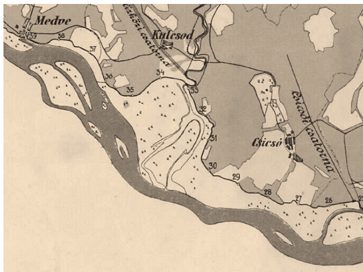
5. ábra A szabályozás utáni első gátrendszer még a hullámtéren hagyta a Csicsói-holtágat (1920-as évek).

Figure 4. The Csicsó anabranch on the second military survey map (from the 1820s). Note the significant changes of the main stream and the anabranch system of the Danube, compared to Fig. 3.