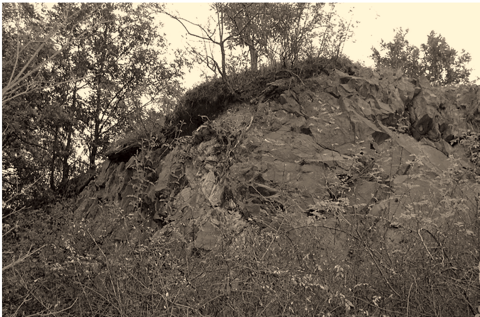
3. ábra A Vár-kúti andezit kőfejtő feltárása Figure 3. Exposure of the Vár-kút andesite quarry

A Hollókői telér a környék jellegzetes geomorfológiai nagyformájának helyi szinten legjellegzetesebb előfordulása, amely hordozza a telérek típusjegyeit (keskeny, elnyúlt alak, kőzetanyagában a mellékkőzet zárványai, peremein hőhatásra megsült mellékközetek). Bemutatására a Vártúra ösvény keretében jelenleg is sor kerül, a képződmény látthatósága szempontjából nem a legkedvezőbb helyen. Az ÉNy–DK-i csapásirányban 2,5 km hosszan húzódó telérnek csak kisebb szakasza esik a tájvédelmi körzet, illetve a Világörökség területére, így a hagyományos természetvédelmi intézkedésekkel nem biztosítható a forma integritásának megőrzése.