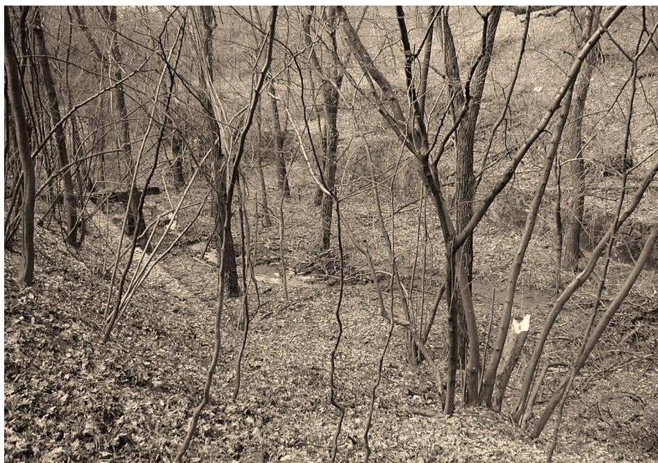
2. ábra Az egykori „parasztfürdő” maradványai Figure 2. Remnants of the former open air bath used by locals

Az elmúlt húsz évben a hollókői táj – elsősorban agrártörténeti – emlékeinek jelentős része végveszélybe került. A fás legelő – mint tájhasznosítási forma és mint jelentős tájképi elem – gyakorlatilag eltűnt, legeltetésével teljesen felhagytak. A fás legelők területe fokozatosan beerdősült – ez a folyamat napjainkban is tart. A zártkert kisparcelláinak többsége évek óta műveletlen, a gazdálkodással felhagytak, különösen igaz ez a Pusztaszőlők és a Nedám-hegy földjeire. A műveletlen területeken megindult a gyomosodás, cserjésedés-erdősülés folyamata. Az egykori parasztfürdő területét visszafoglalta az erdő, csak hosszas keresgélés után található meg az érdeklődő turista (2. ábra).