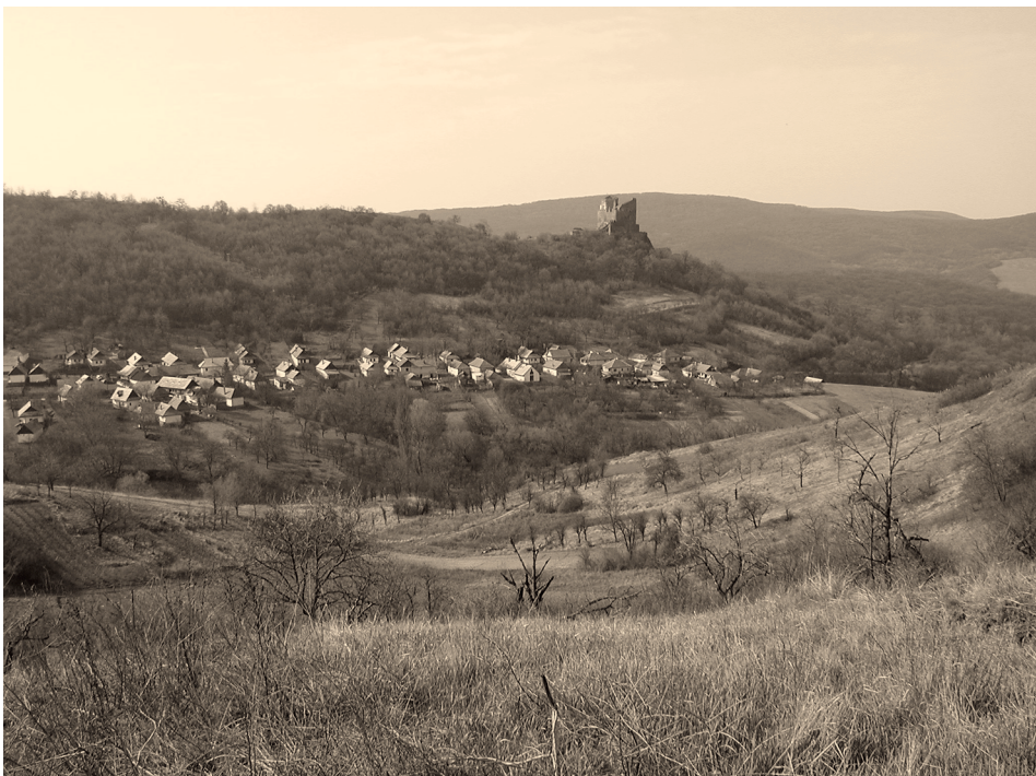
7. ábra A völgymedence látványa az Öregszőlők felől Figure 7. The view of valley basin from Öregszőlők

A tájkarakter vizsgálata, mindenek előtt az értékes, hagyományőrző és bemutatható táj-elemek értékelése, valamint a jelenlegi tájhasznosítás és a környezet állapota alapján meghatároztuk a tájgondozási és környezetrendezési szempontú kezelési övezetbeosztást. Az övezetek nem feltétlenül esnek egybe a tájvédelmi körzet természetvédelmi kezelési övezeteivel, hiszen a Világörökség kezelésénél egyrészt a különleges tájkarakter védelme, a kultúrtörténeti emlékek gondozása, fenntartása és bemutatása a meghatározó feladat. A Világörökség kezelési tevékenységnek valamint a természetvédelmi kezelés élőhely- és élővilág védelmi tevékenységének egymással összhangban kell lennie, egymást kiegészítve kell működnie.