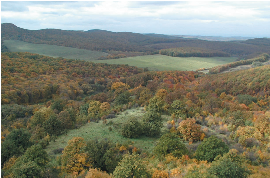
5. ábra A fás legelő megmaradt részlete a Várhegy oldalában Figure 5. Detail of the wooded pasture left at Vár Hill