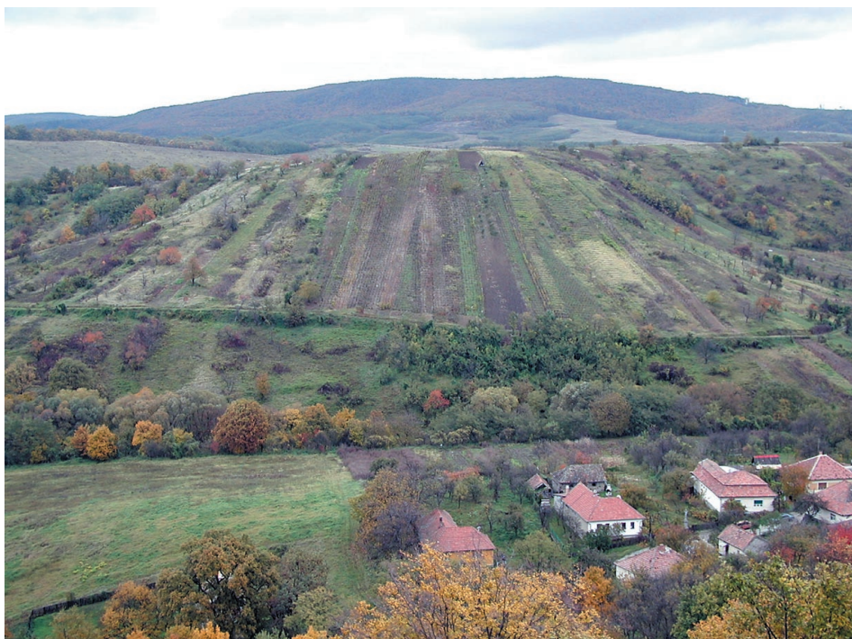
6. ábra Szalagparcellás természetföldek (Öregszőlők) Figure 6. The structure of narrow stripes of arable land (Öregszőlők)