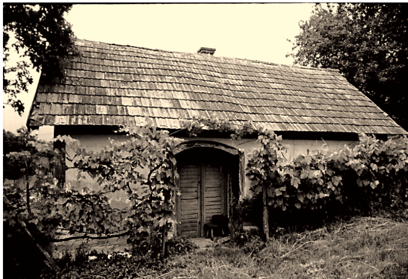
2. ábra Háromosztatú présházpince, Bazsi Figure 2. Three roomed vault with presshouse, Bazsi