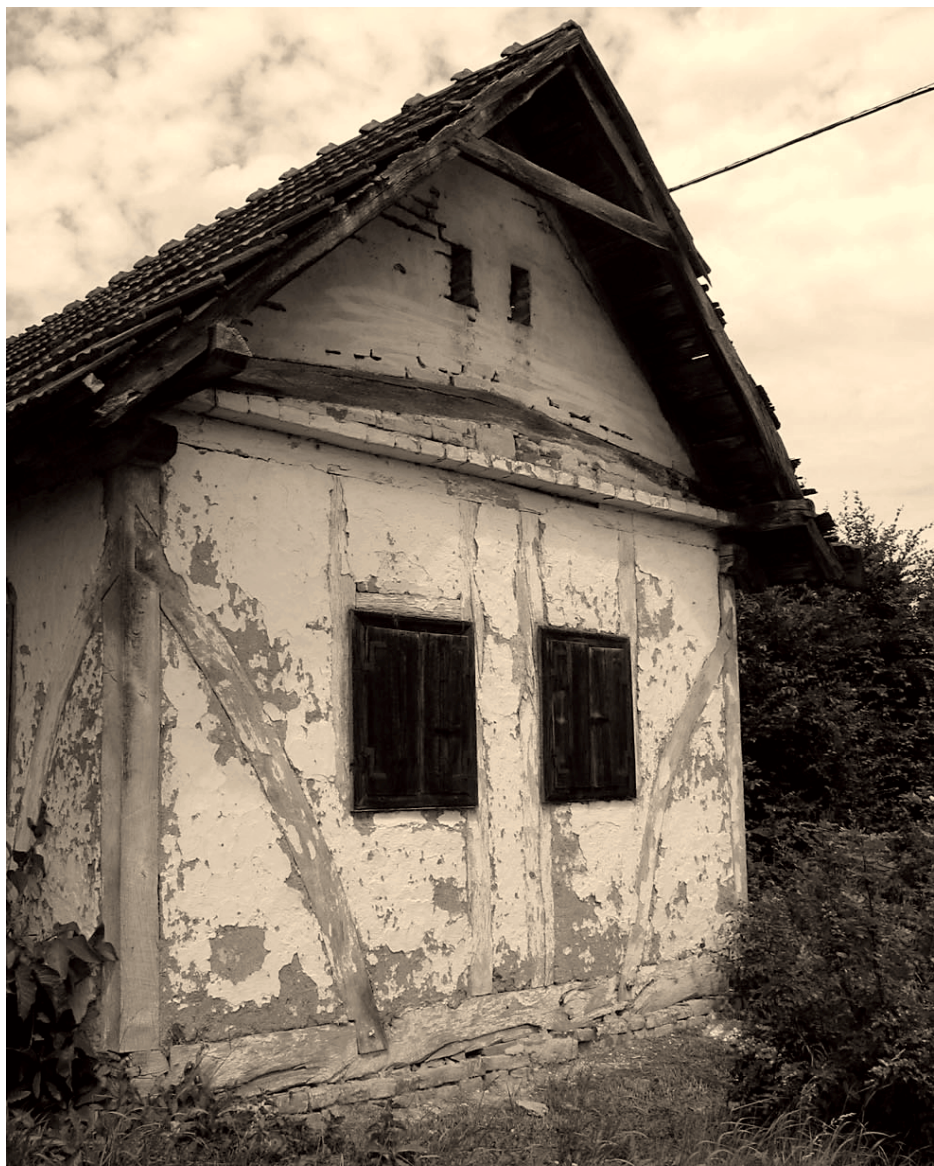
5. ábra Hagományos faépítkezés Eszteregnye szőlőhegyéről Figure 5. Traditional wooden buildings in vineyards of Eszteregnye

megélhetésben betöltött szerepe. A gazdálkodásra szerveződött közösségek szétesése már a komplex szabályozás megszűnésekor elkezdődött, s azóta is folyik. A birtokosok körében többnyire ma is él még a szőlőbirtokhoz való kötődés, de a szőlőhegyek értékrendben betöltött szerepe közel sem hasonlítható az egykorihoz.