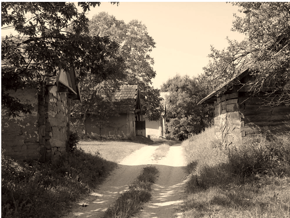
4. ábra Lendvadedes szőlőhegye (szabályos utcahálózat, utcás elrendeződés) Figure 4. Vineyard of Lendvadedes (symmetrical development method, regular streets)

ság után hazánkba telepített német származású mesterek munkájának tulajdonítja, ami a vizsgált szőlőhegyek tekintetében is egyértelműen kimutatható. Legértékesebb példái Eszteregnye szőlőhegyén láthatók (a Mura völgyét szegélyező dombsor része), de szép példái láthatók a szintén dél-zalai Börzönce szőlőhegyén is (5. ábra).