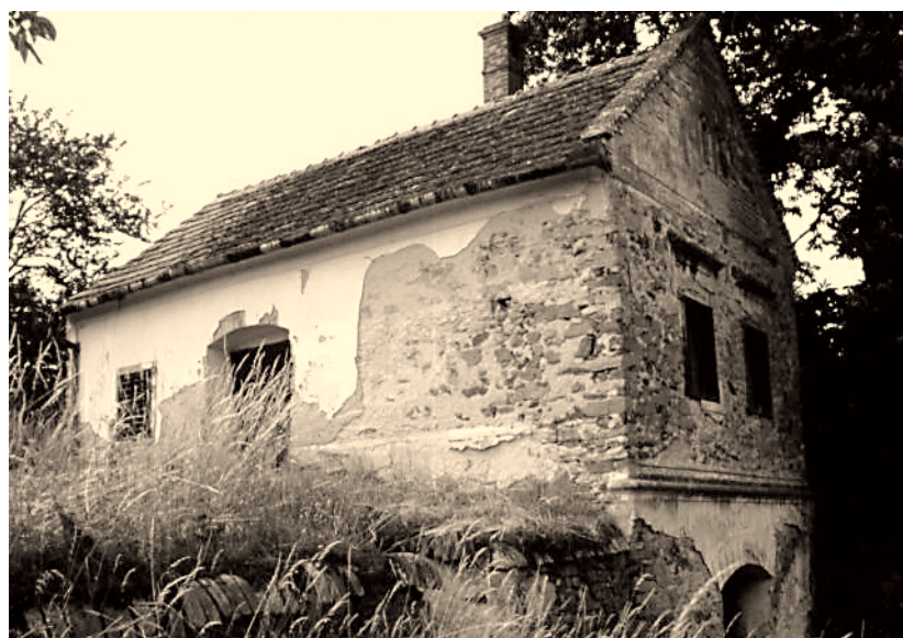
3. ábra „Emeletes” présházpince (Kisgörbő) Figure 3. “Storeyed” presshouse, Kisgörbő

(csapolt- és keresztboronafalás, zsilipelt boronafalás pincék). Ez az építkezési gyakorlat a vizsgált szőlőhegyeken leginkább a melléképületeken maradt fenn.