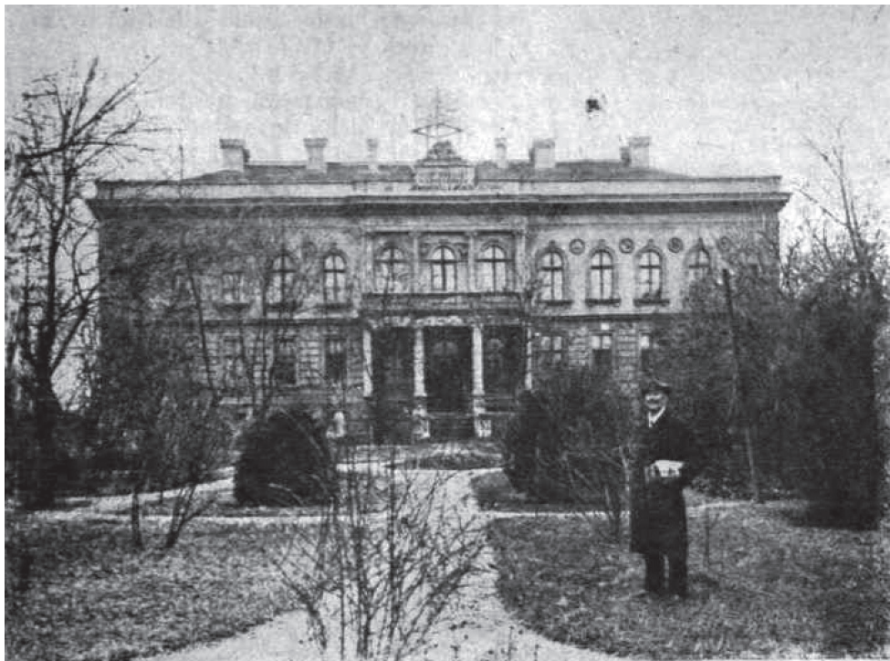
1. kép A Lechner Ödön tervei alapján 1871-ben épült Honvéd Menház 1921-ben

díszítette. Az 1871. október 1-jén tartott ünnepségen az alapkö alá helyezték el a függetlenségi harc számos okmányát, több arany- és ezüstpénzt, valamint Kossuth-bankjegyeket. A kiegyezésig száműzetésben élő és hazatérése után a magyar királyi honvédség megszervezésében elvülhetetlen érdemeket szerzett Vetter Antal altábornagy érdemjele, Gáspár András tábornok országos honvédegyleti elnök arcképe, továbbá a még életben levő valamennyi '48-as honvéd névsora is az alapkö alá került. 15