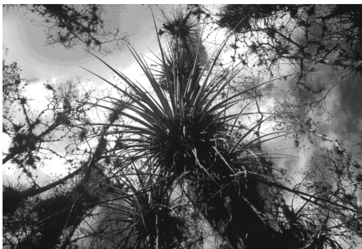
1. ábra A Loxahatchee Nemzeti Vadmenedék tipikus látképe a látogatók szemszögéből, a bemutató ösvény fölötti broméliákról, Florida, USA

Figure 1. Typical view of the bromeliads above the study trail from the visitor's eye-level, Loxahatchee National Wildlife Refuge, Florida, USA