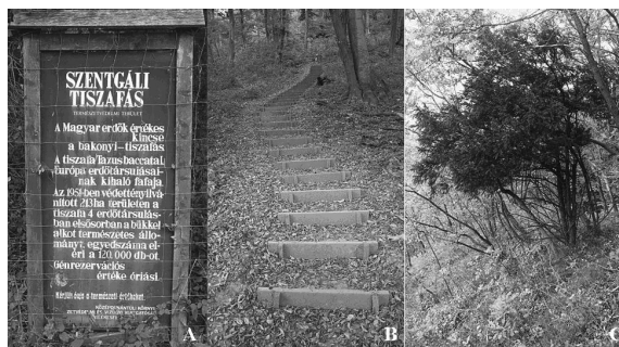
4. ábra A Szentgáli Tiszafás (A: ismertető tábla, B: lépcső a bejáratnál, C: tiszafa)

A természetvédelem történetében fontos szerepet játszottak a korábbi vadaskertek, illetve nemesi birtokok, ahol nemesi kiváltság volt a vadászat. A 13. századtól a Bakonyban is éltek ezen kiváltságok, és a vadállomány karbantartása jó hatással volt az őshonos tiszafára is. A vadászat nyilvánvalóan nem a természeti értékek védelme érdekében ritkította a vadállományt, ezen a területen mégis természetvédelmi jelentőségű volt a tevékenység.