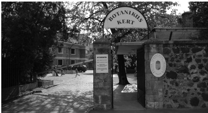
5. ábra A Vácrátóti Botanikus Kert bejárata Figure 5. Entrance of the Botanical Garden of Vácrátó

Az arborétum az 1830-as években kezdett kialakulni, erre a Rákos-patak mentén húzódó éger-szil-köris ligeterdő adta az alapötletet, létrejöttét azonban csak a világ első nemzeti parkja (Yellowstone) alapításának idejére, 1872-re teszik. Ekkor került a terület a természetszerető Vigyázó Sándor tulajdonába, aki megbízást adott egy angolpark létrehozására. A romantikus elképzelések közül sok megvalósult, a harminc év alatt kialakított romantikus kertben megépült egy gótikus álrom, több tó, egy műbarlang, egy kis vízimalom és számos mesterséges domb is.