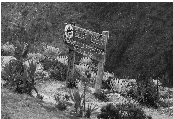
2. ábra A Sierra Nevada Nemzeti Park határát hirdető tábla, háttérben a „meridai páramo” növényzetével, Venezuela

Természeti kincsei ellenére a menedék komoly veszélyben van az invazív növények miatt. A gyorsan növő széleslevelű papírkéreg ( Melaleuca quinquenervia ) és az Óvilági kúszó páfrány ( Lygodium microphyllum ) gyorsan fölé nő a helyi flórának és láthatóan nem kompatibilis az őshonos állatvilággal. A jelenség sajnos egyre szélesebb körben ismert a védett területeken. Az emberi túlhasználat ellen talán segít, hogy a terület nagy része állandóan víz alatt van vagy mocsaras, és a fele nagyközönség számára nem látogatható (HTTP5).