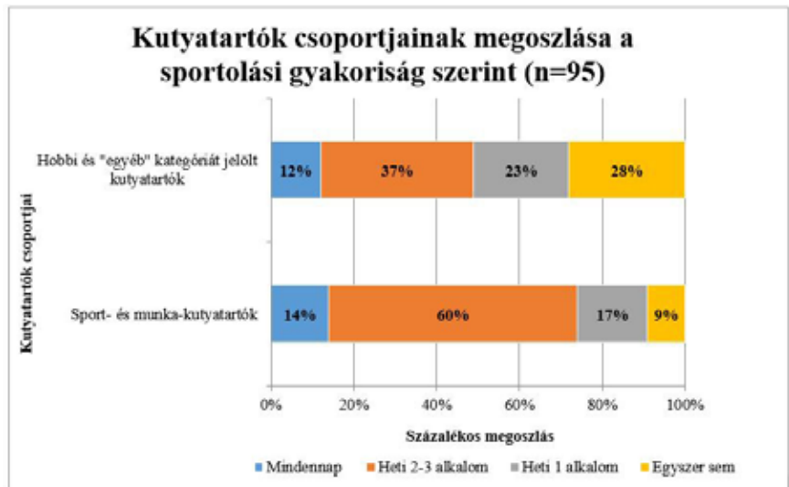
Ábra 2. Kutyatartók csoportjainak megoszlása a sportolási gyakoriság szerint Groups of dog keepers based on the frequency of their exercise

Következésképpen, szignifikáns különbség van a sport- és munkakutyát tartók, és hobbi- és egyéb-kutyások sportolási gyakorisága között. A vonatkozó adatokat az alábbi diagram szemlélteti.