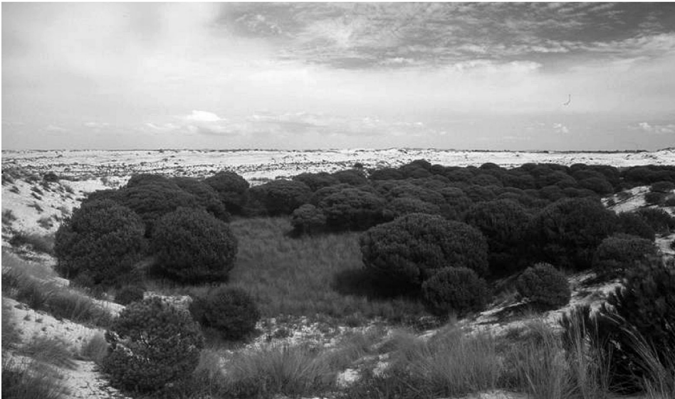
2. ábra Mozdgó homokdűnék közt megmaradt füves-fás terület a Doñana Nemzeti Parkban

A parkban vándorló homokdűnék (2. ábra), a kanyargó folyó vízállásos területei és mocsaras részei speciális élőhelyeket alakítottak ki, amelyek elsősorban a vízi élővilágnak kedveznek.