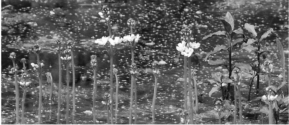
8. ábra A békaliliom ( Hottonia palustris ) virágzó példányai Figure 8. Some flowering Featherfoil ( Hottonia palustris )

kell említeni a parti sást ( Carex riparia ), a mocsári sást ( Carex acutiformis ) és a széleslevelű békakorsót ( Sium latifolium ). Ritkaságok közé tartozik a szálkás pajzsika ( Dryopteris carthusiana ) és a tőzegpáfrány ( Thelypteris palustris ). Májusban nagy tömegben találjuk itt a békaliliom ( Hottonia palustris ) virágzó példányait (8. ábra).