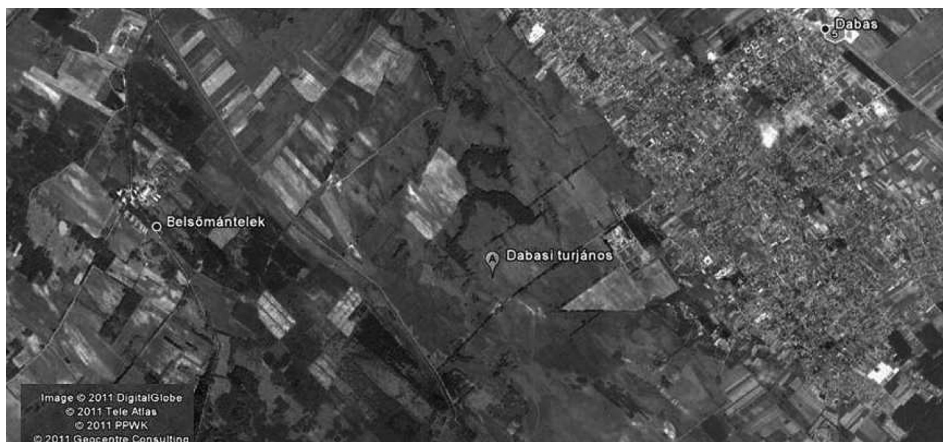
7. ábra A Dabasi-turjános elhelyezkedése

A Dabas és Belsőmántelek között fekvő (7. ábra) természetvédelmi területet 1966-ban nyilvánította védetté az Országos Természetvédelmi Hivatal, majd 1987-ben területét 148 ha-ra növelték és fokozottan védetté nyilvánították. A turjános annak köszönheti létét, hogy a Duna-völgyi főcsatorna 1912-ben meginduló munkálatai során nem csapoltak le minden területet, illetve egy korábbi tó alján vízzáró réteg alakult ki, így az Ős Duna kb. 9000 évvel ezelőtti elvándorlása után a környező homokhátságról leszivárgó vizek időszakosan magas talajvízállást tudnak biztosítani. A valaha Ócsától Bajáig terjedő vizegyes foltok, mocsarak, lápok és turjánok mára jelentősen megfogyatkoztak.