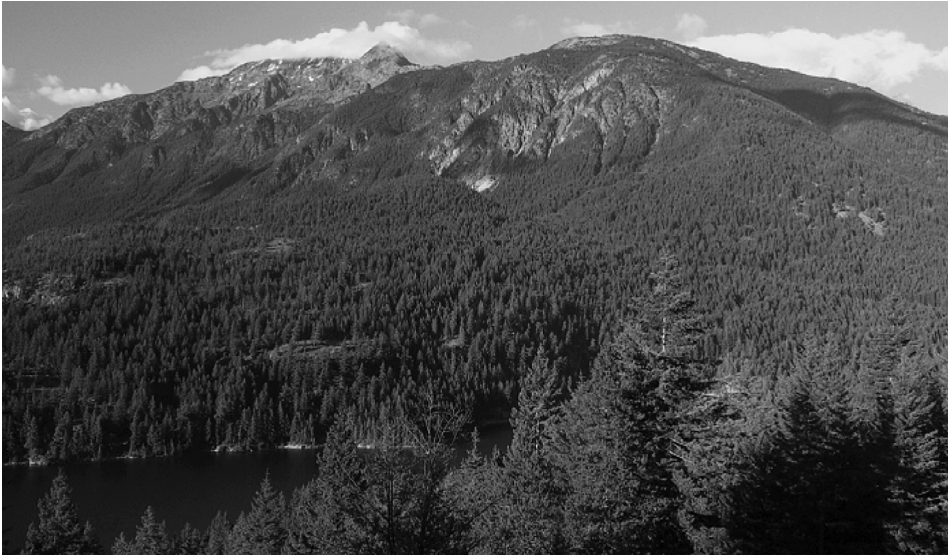
6. ábra A North Cascades Nemzeti Park jellegzetes tájképe (USA) Figure 6. Typical landscape in the North Cascades National Park (USA)

A komplex egy kb. 1,2 millió hektáros, határon átnyúló terület része, amely így vándorló és veszélyeztetett fajoknak is komoly menedéket tud nyújtani. Az amerikai kongresszus 1968-ban hozta létre a komplexumot, hogy megőrizzen bizonyos hegyvidéki tájképeket, hómezőket, gleccsereket, hegyi réteket, tavakat és más unikális glaciális képződményeket a jelenlegi és a jövőbeli generációk hasznára, használatára és ihletésére.