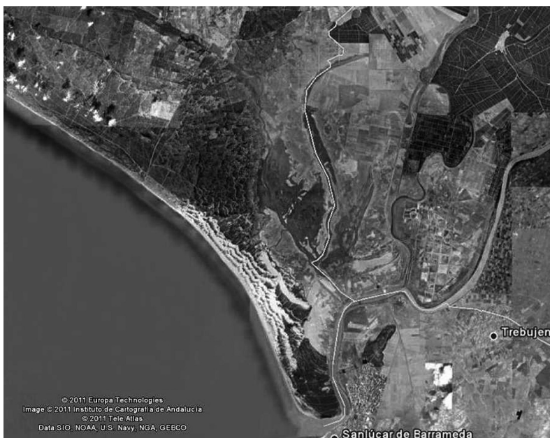
1. ábra A Doñana Nemzeti Park elhelyezkedése a Guadalquivir folyó jobb partján

A park a hatalmas, 230 ezer ha-os „Marismar del Guadalquivir” fontos madárélőhely (IBA) szíve (1. ábra). A park elődje egy biológiai rezervátum volt, amelyet 1965-ben alapítottak. A parkot 1969-ben hozták létre 34 625 ha-on, majd 1978-ban 50 720 ha-ra bővítették. 1980-ban a pufférzónájával (26 540 ha) együtt bioszféra rezervátum lett (összesen 77 260 ha-on). 1982-ben került be a Ramsari területek közé, majd 1994-ben lett világörökség (HTTP4).