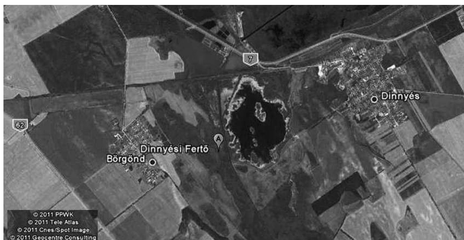
9. ábra A Dinnyési-fertő elhelyezkedése Figure 9. Situation of the Dinnyési-fertő

A természetvédelmi terület nem csak madártani, hanem növénytani értékei miatt is kiemelkedő természeti értékünk. A többi vizenyős, lápos, mocsaras területünkhöz hasonlóan ez a terület is egy valaha nagy kiterjedésű vízi világ hírmondója. A XX. század elejéig a Velencei-tótól a Sárrétig húzódó egybefüggő; tavakat, mocsarakat és lápokat magába foglaló vizenyős területek láncolatát képező rendszer része volt. A környék vizenyős területeit csak hosszas munkálatok után sikerült lecsapolni, majd a vasút kialakítása végleg elvágtá a déli részeket a Velencei-tótól. A megmaradt néhány száz hektárt 1966-ban természetvédelmi területté nyilvánították (HTTP14).