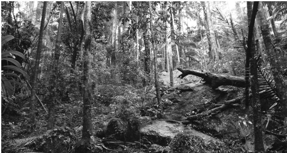
4. ábra Az ausztrál Wollumbin (Mt. Warning) Nemzeti Park csúcsra vezető ösvénye mentén ilyen őserdőt találunk

Ezen törvények betartását senki nem ellenőrzi, csak javasolt a látogatók számára. A természetvédelem története szempontjából fontos esemény, hogy az őslakosok jogait kezdik fokozottabban figyelembe venni, így egyre több helyen jelenítik meg a védett területek nevét is az őslakosok nyelvén. Ausztrál példánál maradva ilyen jó példa az Uluru név használata is az Ayer’s Rock mellett.