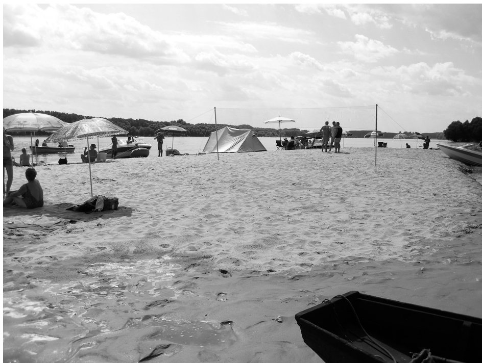
2. ábra Strandolás a Baja környéki homokzátonyokon Abbildung 2. Badestrand an der Sandbank in der Naeh von Baja

be. A 2–5 napra érkezők részaránya 25%. Érdekes, hogy Gemencen a válaszolók 50%-a jelölte meg a természetjárást, mint családi programot és csak 17% volt a horgászat, mint elsődleges hobbi. Ezzel szemben Béda-Karapancsán a horgászat és a természetjárás aránya egyenlő, közel 40-40%-os részarányú.