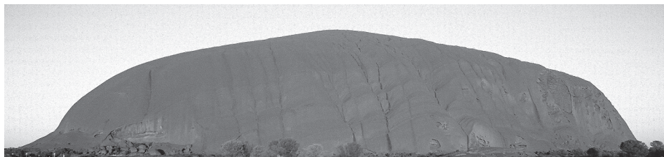
1. ábra Az Uluru vörös homokkő monolitja, Ausztrália Figure 1. The red sandstone monolith of the Uluru, Australia

Egy William Gosse nevű térképész 1873-ban fedezte fel a kupolaszerű szikla-dombok láncolatát. Az itt fekvő legnagyobb vörös homokkő monolitot Ausztrália miniszterelnökéről, Sir Henry Ayersről, Ayers Rock-nak nevezte el (1. ábra). A szikla legnagyobb szélessége 1,9 km, legnagyobb hossza 3,6 km, kerülete 9,4 km, alapterülete 3,3 km 2 , legmagasabb pontja 348 m. Keletkezésének idejét 600 millió évvel ezelőtre teszik. Színe vörös, amely a Nap fényének változásait követve a halvány rózsaszíntől, az izzó vörösig más-más színben játszik a nap égi vándorlásával. A szikla közelében eukaliptuszok ( Eucalyptus sp. ) is megjelennek, mert itt viszonylag több nedvességhez jutnak, amely elegendő a megmaradásukhoz.