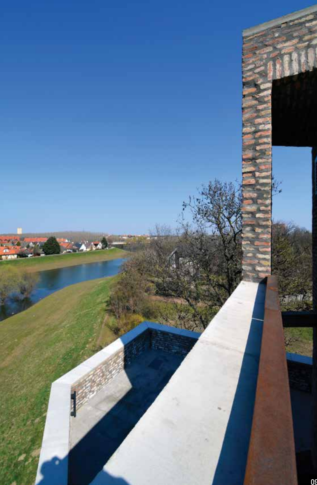
09 Kilátás a látogatóközpont tetőteraszáról, háttérben a Zagyva

[5] is kíván lenni, amennyiben az emlékezés lehetetlensége miatt azt elősegítő, helyettesítő tárgyi valóságként fogalmazódott meg, az egykori szolnoki vár emlékműveként legalább annyira értelmezhető törekvésként. Az épület zártsága, a falak súlyos monolitikussága, a téglá- és betonfelületek durvasága, az anyaghasználat általános nyersesége, a forma szinte spontaneitást tükröző, alulról felfelé szűkülő szabálytalansága vagy a belső terek szűrt fényviszonyai nem ábrázolni, hanem kifejezni képesek. Mindez nem az építészet absztrakt, hanem valóságos nyelvét használva igyekszik átélhetővé tenni azokat az érzéki élményeket, amelyek