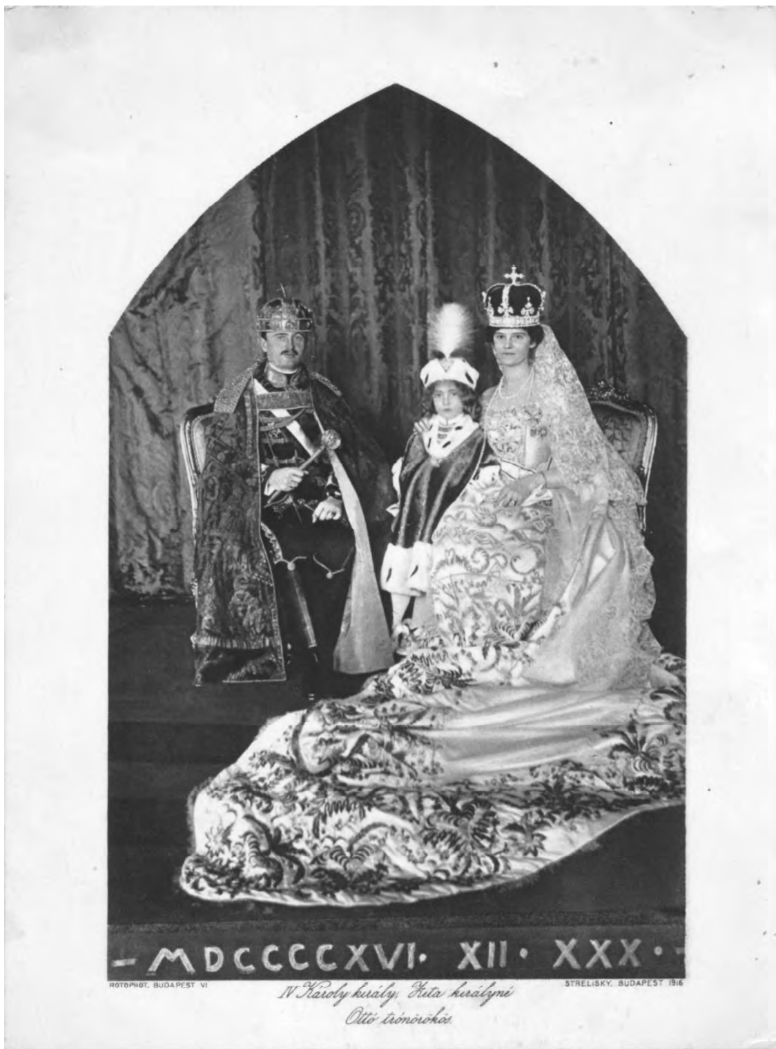
Koronázási emlék, 1916