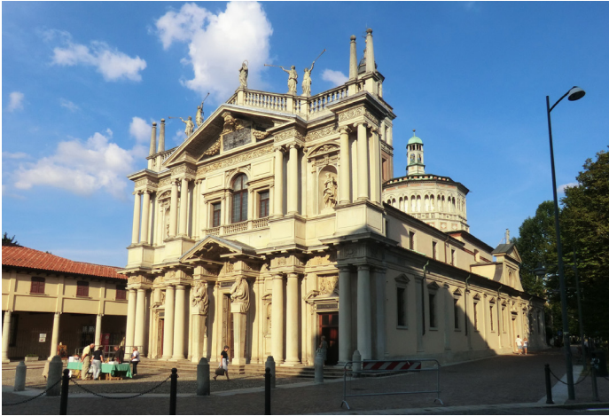
5. kép. Pellegrino Tibaldi: a saronnói templom (Santuario della Beata Vergine dei Miracoli) homlokzata

Meg kell még említenünk Pellegrino Tibaldi különleges oltárarchitektúráit is, amelyek épülethomlokzatait követik és összefüggnek az általa tervezett stukkódíszítményekkel. A stukkó művészetét Pellegrino az 1540-es években, római tanulóévei alatt, előbb Perino del Vaga, később Daniele da Volterra mellett sajátította el. Első önálló munkája Poggi bíboros bolognai palotájának stukkódíszje volt (1550–1551 között), ezt követték az anconai Loggia dei Mercanti stukkódíszjei (1558–1560). 29 A bolognai Palazzo Poggi stukkódíszének jellemző motívumai a figurális hermapilaszterek, a női büsztök szinte teljes háromdimenziós megformálásúak, expresszív fiziognómiával. Önálló körplasztikaként hatnak az anconai kereskedők székházában a boltozat fülkéibe helyezett erényalakok is.