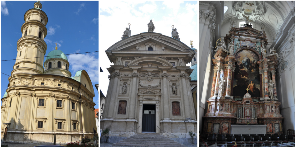
16–17. kép. Pietro de Pomis: II. Ferdinánd grazi mauzóleuma