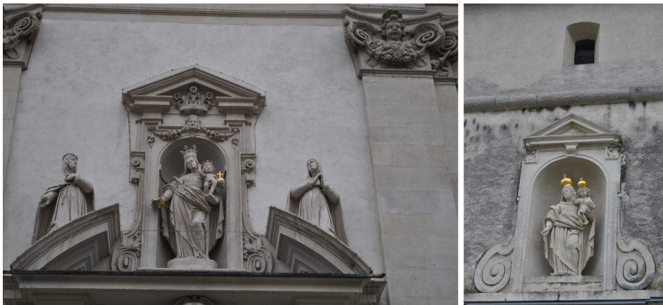
21. kép. A bécsi domonkos templom portáljának timpanonja 22. kép. A fraknoi (Forchtenstein) vár kapuja fölötti szoborfülke