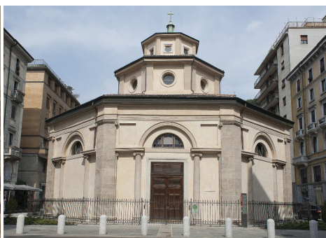
3. kép. A milánói Lazzaretto kórház 1882-ben.

inv.Albo G116/18.