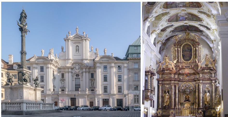
32. kép. Bécs, Kirche am Hof, homlokzat