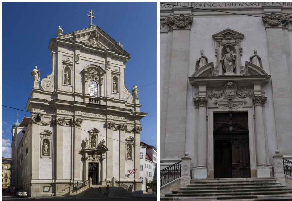
19–20. kép. A bécsi domonkos templom homlokzata és portálja

család több tagjával együtt. Ebből a tényből a lombardiai építészet ismeretére következtethetünk. Épp ilyen fontos adat, hogy testvére, Costante (megh. 1647) igazolhatóan Rómában, Carlo Maderno mellett dolgozott a San Pietro bazilika munkálatain. 48