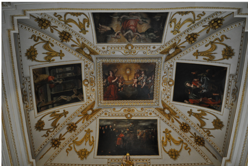
29. kép. Győr, Szent Ignác jezsuita (ma bencés) templom, Szent Pál-oltár 30–31. kép. Bécs, Kirche am Hof, (egykor jezsuita templom) eucharisztikus kápolna, oltárépitmény és mennyezet stukkódíszje