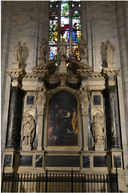
6. kép. Pellegrino Tibaldi: a milánói Dóm Szent József-oltára