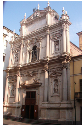
8. kép. Pellegrino Tibaldi: Chiesa Santi Martiri, Torino