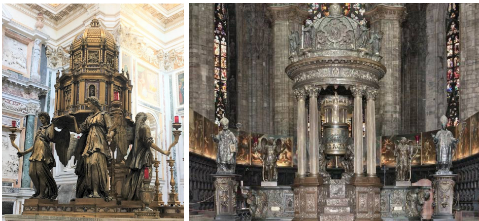
1. kép. Bastiano Torreggiano – Jacopo del Duca: A római Santa Maria Maggiore bazilika tabernákuluma 17

Santa Maria Maggiore bazilika Cappella Sistinájában , a ferences V. Sixtus pápa megbízásából 14 (1. kép). Ebben a bazilikában őrizték a betlehemi jászol ereklyéjét, ezért a pápa, amikor saját kápolnáját kialakította, egyben kultuszhelyet tervezetett az ereklye számára is. A földalatti helyiségbe lépcsők vezettek, följe épült az oltár, az ókeresztény eredetű confessio (ereklyekápolna) típusát újítva fel. 15 Mély összefüggés figyelhető meg a jászolereklye és a fölötté emelkedő oltárépítmény között, amelyet a bazilika karácsonyi szentmiséje során azzal a gesztussal hangsúlyoztak, hogy az átváltoztatott szentostyát a jászol ereklyetartójára helyezték. 16 A sokszög alaprajzú, kupolás tabernákulum építményt, amelyet Domenico Fontana tervei nyomán Bastiano Torreggiano és Jacopo del Duca készített, angyalok hordozzák a vállukon, így sajátosan lebegő hatást kelt.