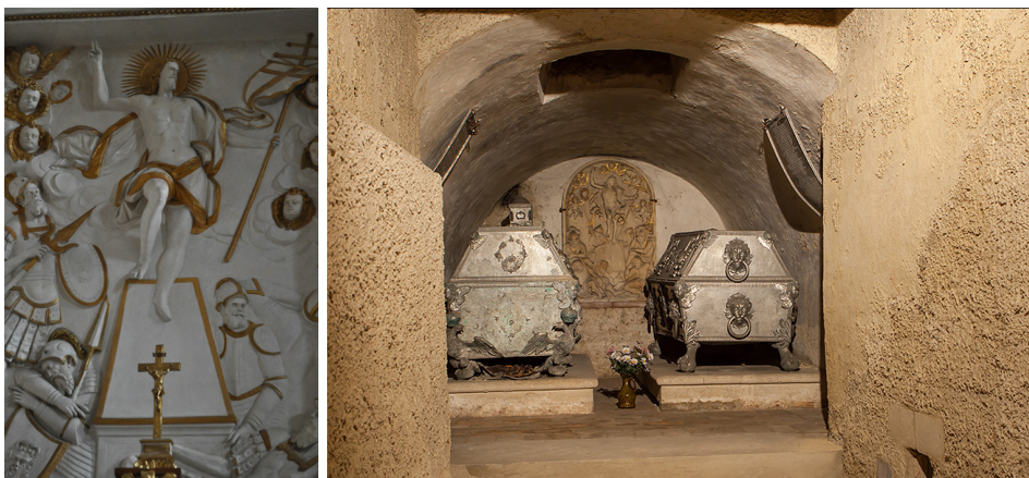
23. kép. Krisztus feltámadása – a kismartoni (Eisenstadt) ferences templom mellékoltáráról 24. kép. Krisztus feltámadása – Claudia Felicitas császárné kriptája a bécsi domonkos templom kriptájából