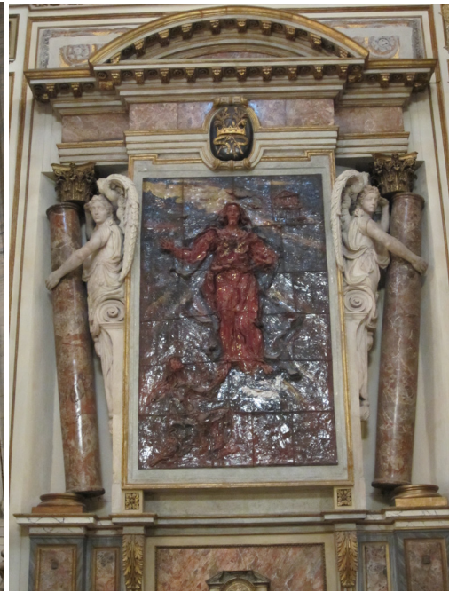
7. kép. Pellegrino Tibaldi: a milánói San Fedele jezsuita templom oltára

jére utaló szimbólummal van dolgunk: a szövetség ládáját tartó szeráfokra vagy az egyházat fenntartó isteni erőre kívánt így utalni az építész. 31