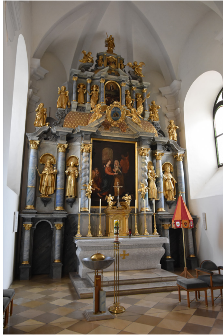
28. kép. Németújvár (Güssing), ferences templom, főoltár

Itáliában a 16. századtól kezdve terjedt el, s itáliai művészek hozhatták el Grácba is, ahol bár a források alapján az oltártípus előfordulása dokumentálható, nem ismertek fennmaradt példányaik, mert a 18. században modernebbekkel helyettesítették őket. 62