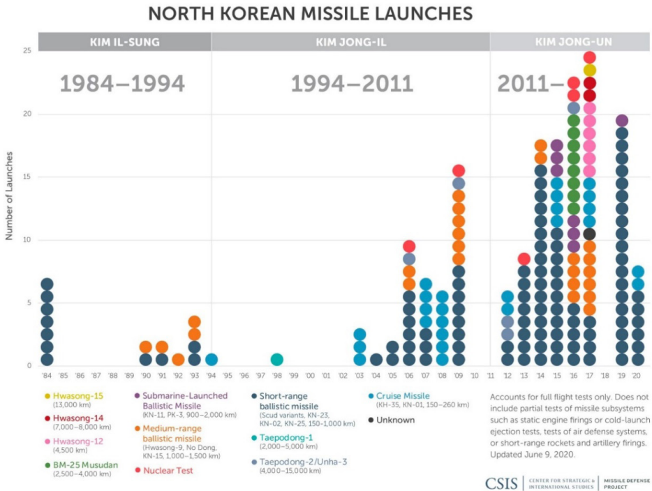
1. ábra 1 Észak-Korea rakétakísérletei 1984-től

A 2013. februári atomrobbantást követően világossá vált, hogy Kim Dzsongun teljes gőzzel halad a célja felé, és az már Pekinget is nyugtalansággal töltötte el, hogy nem látszott, meddig akar elmenni az ifjú diktátor. Egy Kínában rendezett éves regionális üzleti fórumon Hszi Csin-ping elnök – láthatólag a Koreai-félszigetre utalva – kijelentette, „nem szabad engedni, hogy bárki is káoszba taszítson egy térséget vagy akár az egész világot pusztán önös előnye érvényesítése érdekében” (Perlez és Sang-hun, 2013). Azonban Kim Dzsongun a hatalma