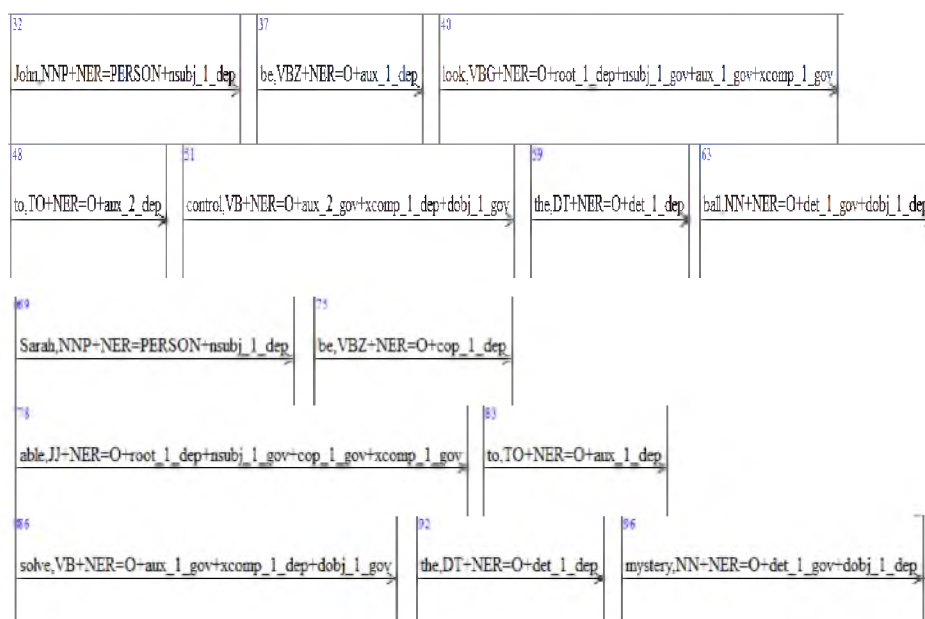
3. ábra: Két példamondat, ahol a megtalálandó ige nem közvetlenül kapcsolódik a cselekvőhöz. „John is looking to control the ball.” és “Sarah is able to solve the mystery.” mondatok coreNLP általi elemzésének bemenete a NooJ szoftverben

Az eddigiekben csak olyan esetekről szóltunk, amikor a megtalálandó ige állítmányi pozícióban van a mondatban. A következőkben két olyan példát mutatunk be, ahol a megtalálandó ige nem kap „nsubj dependency” kategóriát. Ez fakadhat a coreNLP elemzési sajátosságaiból vagy abból, hogy az adott ige valóban nem állítmányi pozíciót foglal el a mondatban. Ilyen esetekben az elemző célja összekapcsolni az igét azzal az entitással, amire vonatkozik, erre láthatunk példát a 3. ábrán.