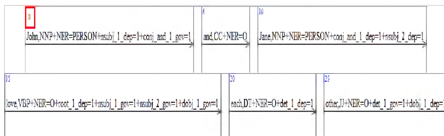
1. ábra: „John and Jane love each other.” mondat coreNLP általi elemzésének bemenete a NooJ szoftverben

Az elemzés három lépésben történik. Az első lépésben a szöveg POS taggelését, a tulajdonnevek felismerését és a szöveg szintaktikai elemzését a coreNLP látja el [2, 13]. Az outputként kapott XML formátumú fájlt egy XSLT fordítóval 1 transzformáljuk, hogy a NooJ [10] külön tudja választani a szöveget és annak annotációit. A szöveg annotációi ebben az esetben szavanként tartalmaznak egy POS taget, egy NER értéket, illetve minden egyes függőségi kapcsolatot, amelyet az adott szó a coreNLP által megkapott. A coreNLP szintaktikai elemzője a mondat szerkezetét szópárok egymáshoz való viszonyának jelölésével képezi le. Az alany-állítmányi kapcsolatban például az állítmány ún. „nsubj governor”, az alany pedig „nsubj dependent” annotációt kap. Egy szó több ilyen kategóriát is kaphat, hiszen például egy állítmányhoz több alany is kapcsolódhat. A NooJ nyelvi elemzőben definiálható szabályok sajátosságai miatt ahhoz, hogy össze tudjuk kötni, mely szavak alkotnak egy szintaktikai szópárt, minden szintaktikai pár kap indexként egy számot. Amikor tehát két alanya van egy állítmánynak, az állítmány két nsubj governor szintaktikai kategóriát kap, melyeket 1 és 2 indexszel látunk el az XML fordítás során. Ugyanezt a két indexet fogja megkapni az első és a második alanya az állítmánynak (lásd. 1. ábra).