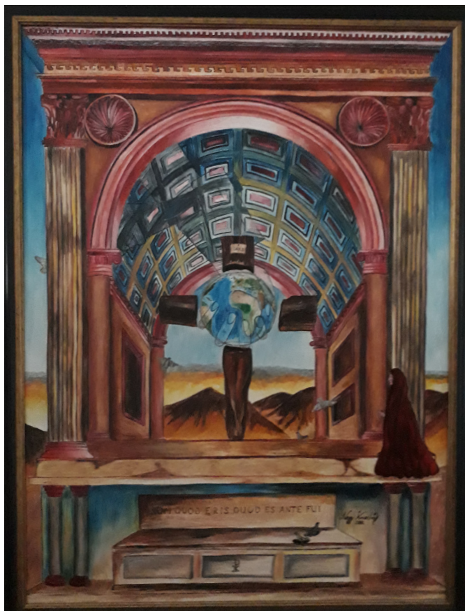
Nagy Krisztián: Pro peccatis nostris