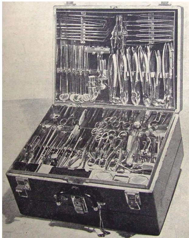
5. kép – Hordozható extractiós fogászati felszerelés (Oravecz Pál (1941): Fogorvosi beavatkozások a betegágyánál. Hordozható klinikai-kórházi fogászati felszerelés. Fogorvosi Szemle 34.:8. 233.)

Saját fejlesztésű eszköz volt az a hordozható klinikai-kórházi fogászati felszerelés, amellyel a klinikákon fekvő betegek ellátását tudták biztosítani. 54 A klinika összeállított külön e célra három fadobozt, melyben a szükséges felszereléseket, műszereket, gyógyszereket és kötszereket könnyen át lehetett szállítani a beavatkozás helyszínére. A felszerelést úgy állították össze, hogy elektromos árammal, de annak hiányában anélkül is el tudják végezni a kezeléseket. A három doboz tartalma a következő volt: 1./ extractio, szájszűrés, érzéstelenítés felszerelése, 2./ konzerváló fogászat, állcsonttörés kezelésének műszerei, 3./ szétszedhető, lábbal hajtható fűrőgép.