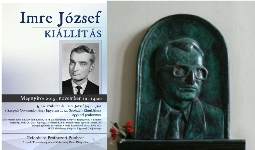
4. ábra kiállítás és szobor Imre Józsefről